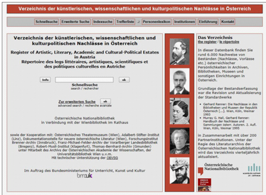
Abb. 3: Screenshot der Startseite (Webseite „Verzeichnis der künstlerischen, wissenschaftlichen und kulturpolitischen Nachlässe in Österreich“)

Zusammenfassend unsere Empfehlung für einen Musterworkflow, der sämtliche Aspekte der Online-Erfassung von Separata, sowie die unterschiedlichen Eigenschaften der jeweiligen Sammlung berücksichtigt: