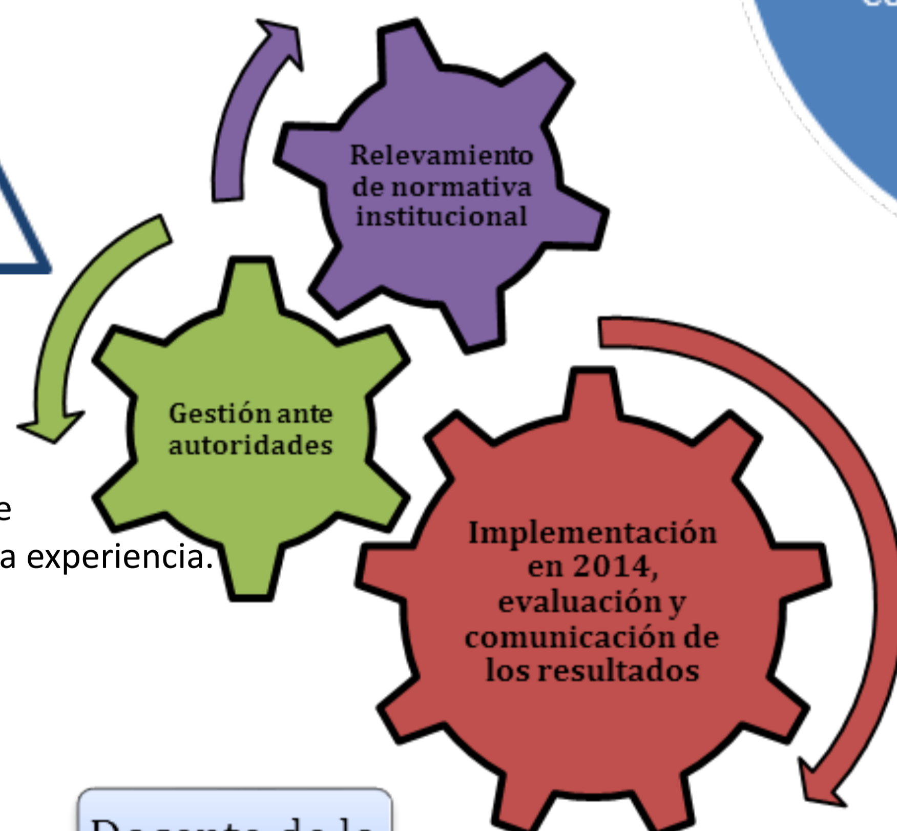
Gráfico 3: Proceso de implementación de la experiencia.