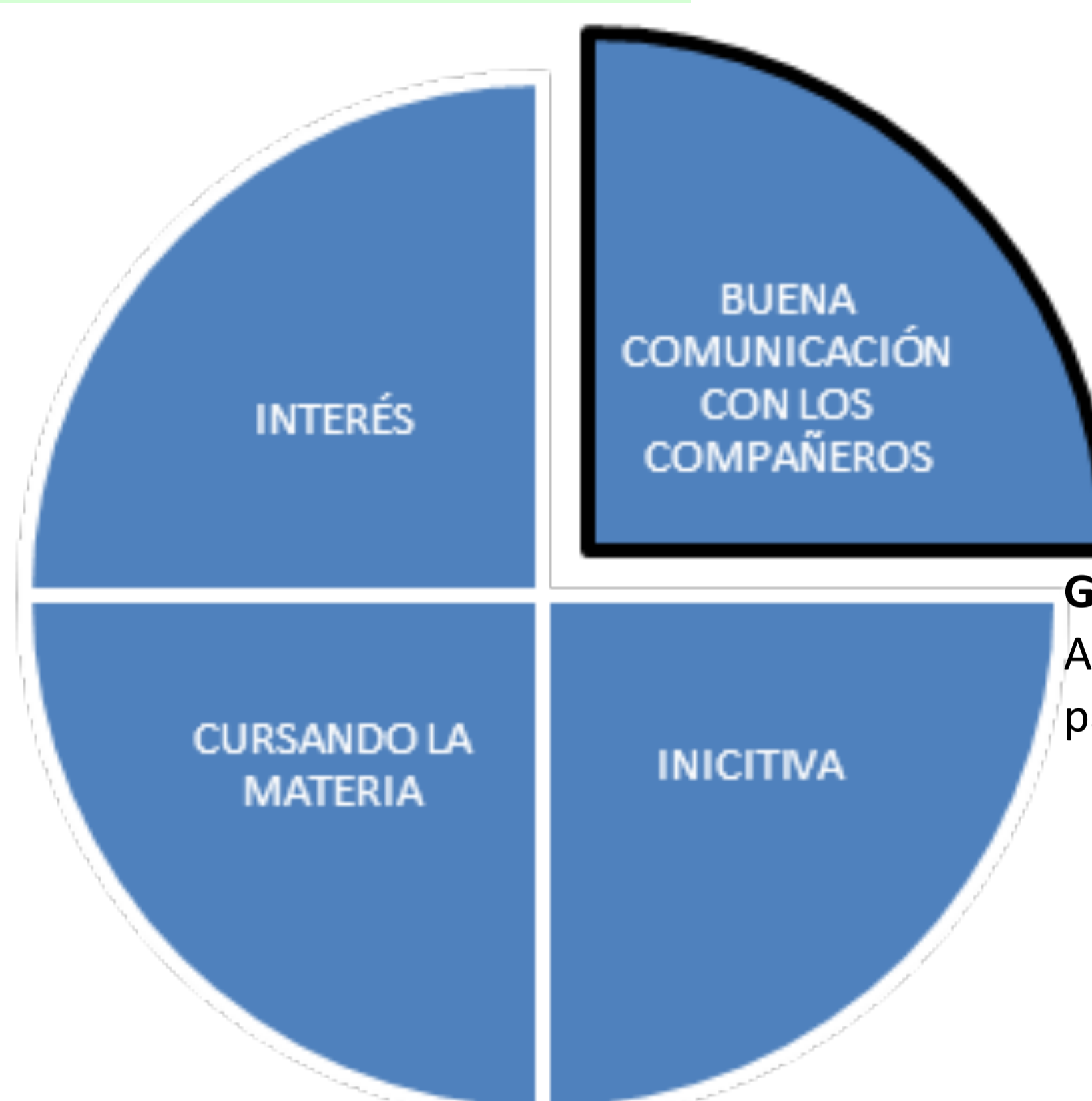
Gráfico 2: Condiciones del Ayudante-alumn@ para su selección.