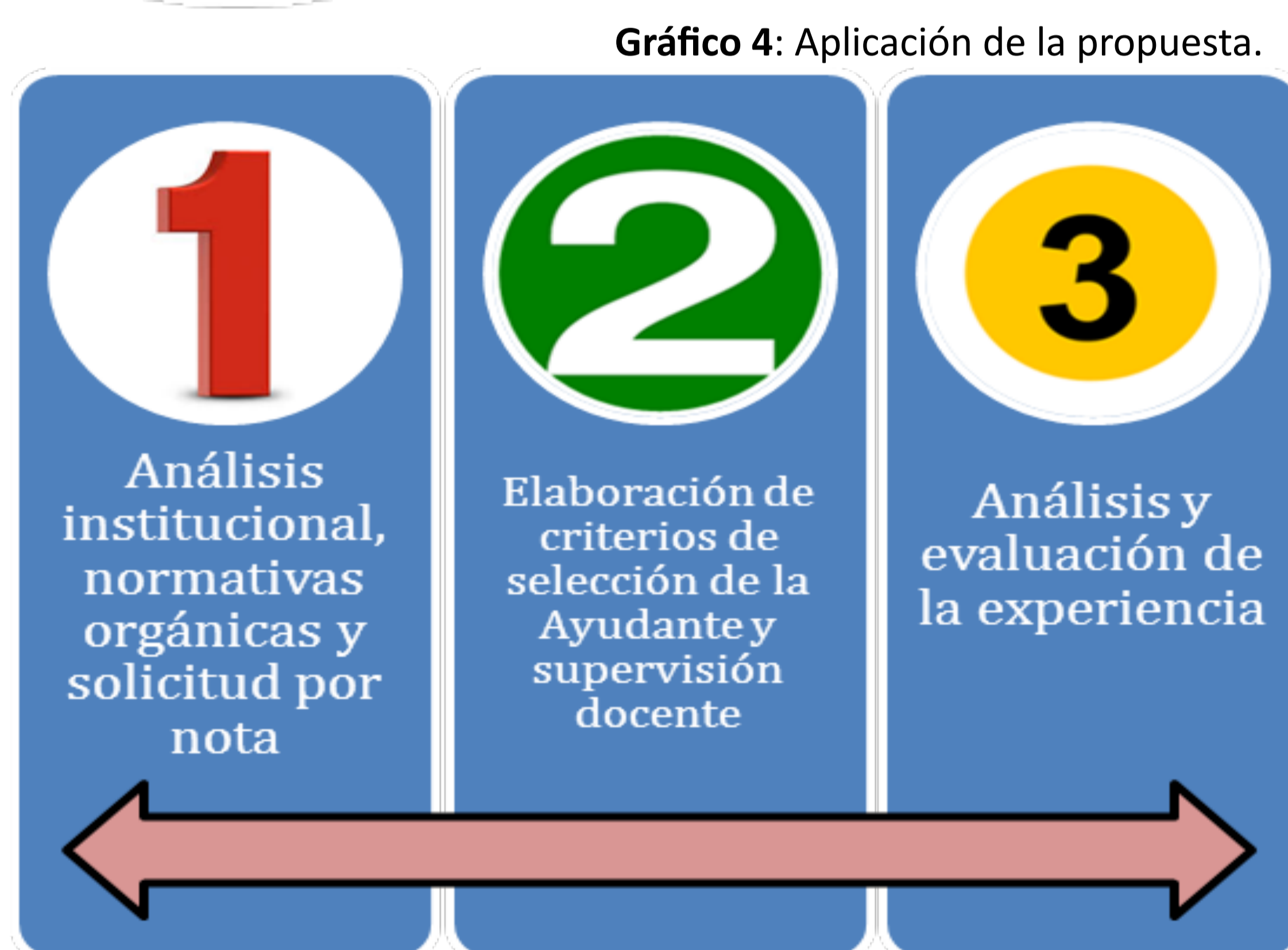
Gráfico 4: Aplicación de la propuesta.