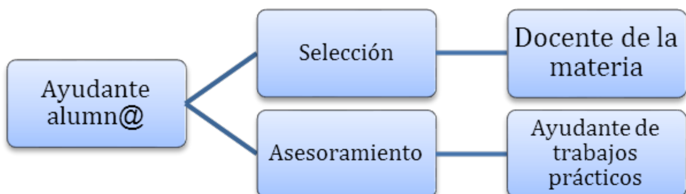
Gráfico 5: Forma de selección y seguimiento del ayudante alumn@