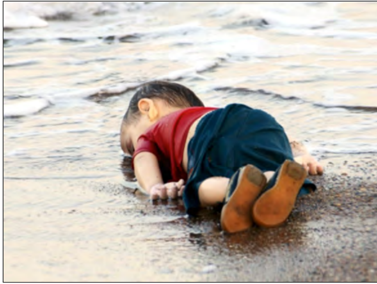
Imagen 1. Fotografía de Aylan Kurdi. Autora: Nilüfer Demir/Agencia Dogan (Reuters, 2015).

proximidad no es solo focal, también lo es de ángulo. La profundidad de campo es lo suficientemente reducida para estar muy próximos a la víctima, recurso expresivo que agrava nuestra impotencia, pero lo suficientemente amplia para dotar de perspectiva al mar, diferenciando un lejos/cerca. La fotografía nos confiere su mirada, por lo que el público se sitúa en su lugar, desde arriba, llegando, acercándose. ¿Quién somos?: alguien en tierra firme, en el destino anhelado de Europa. Se trata de una visión eurocéntrica, diferente a la que tendría un grupo de refugiados alcanzando la orilla. En esa situación, se construye también un dentro/fuera. Tales divisiones emergen como «dicotomías-baliza», significando otredad, desde una subjetividad elevada, erguida, de recepción. La imagen fue encuadrada siguiendo el recurso retórico de la supresión. Anotando el plano detalle del niño y dejando fuera de campo a los agentes que trabajaban en la zona. Ese ejercicio singularizaba y personalizaba de forma muy concreta la tragedia de los refugiados sirios.