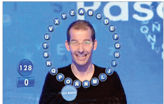
Concurso. Pasapalabra , Telecinco http://www.telecinco.es/pasapalabra

Por tanto hay preferencias por géneros muy dispares. El género preferido, las docuseries, gusta bastante o mucho a casi dos tercios de los espectadores. Sin embargo la telerrealidad es el género menos apreciado, a considerable distancia del resto de contenidos de entretenimiento –sólo gusta bastante o mucho al 12,8%.