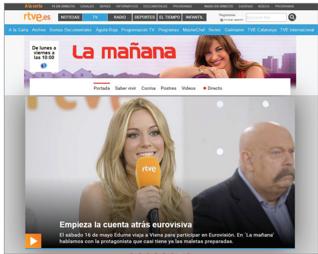
Magazine. La mañana , La 1 http://www.rtve.es/television/la-manana-de-la-1

Estudios recientes también atienden al criterio profesional a la vez que incorporan la percepción de calidad de los te-