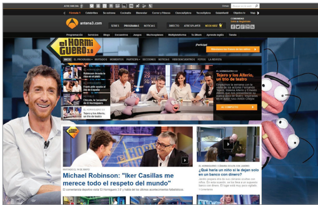
Entretenimiento y humor. El hormiguero , Antena 3 http://www.antena3.com/programas/el-hormiguero