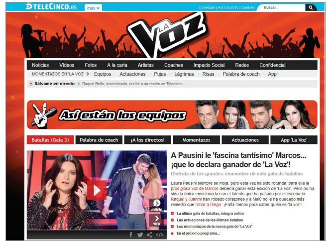
Búsqueda de talentos. La voz , Teletrece http://www.teletrece.es/lavoz

como los factores que tienen un mayor impacto negativo sobre la percepción de calidad.