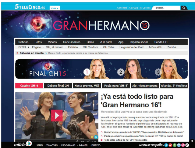
Telerrealidad. Gran hermano , Teletrece http://www.teletrece.es/granhermano