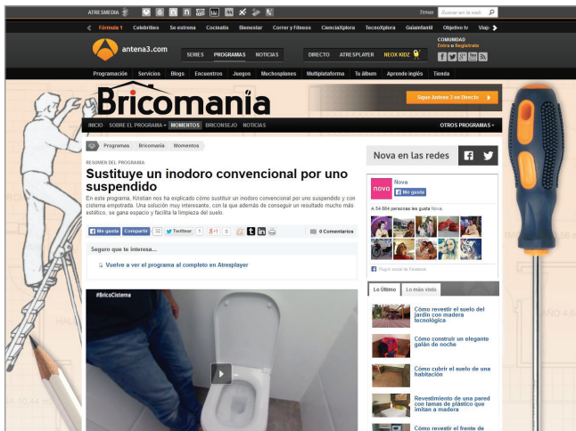
Divulgativos. Bricomania , Nova http://www.antena3.com/programas/bricomania

vos y las docuseries. La relación contraria se ha hallado para los espacios de entretenimiento y humor.