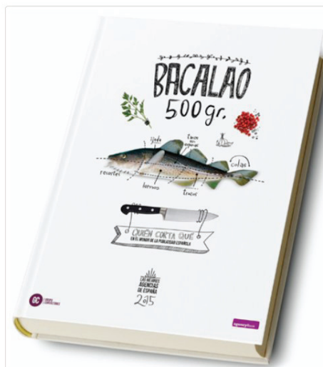
Portada del agencyBook: Las Mejores Agencias en España 2015. © Grupo Consultores.

5 mayo, 2015 Manuel G. Carbajo actualidad