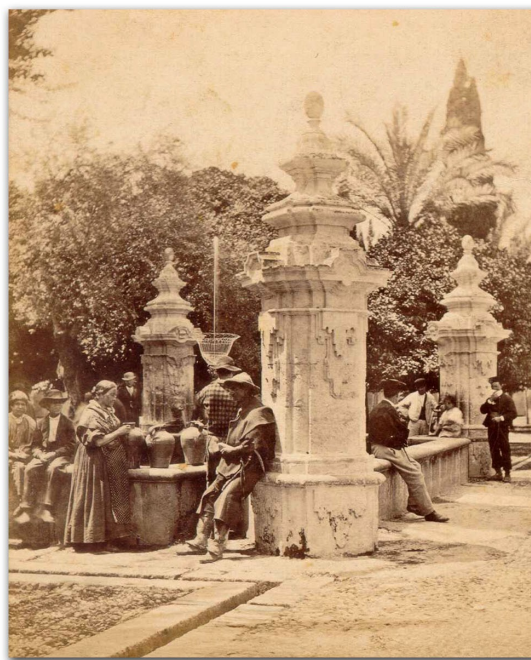
II. 6. Vistas de Tarragona, Sevilla, Córdoba (plaza de la Corredera), y Córdoba (plaza junto a la Mezquita).