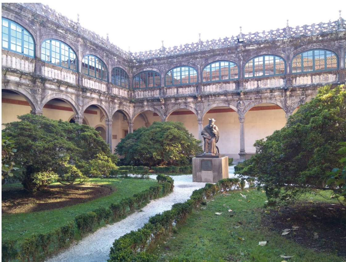
Claustro do Colexio de Fonseca, no que se acha a Biblioteca Xeral da USC.