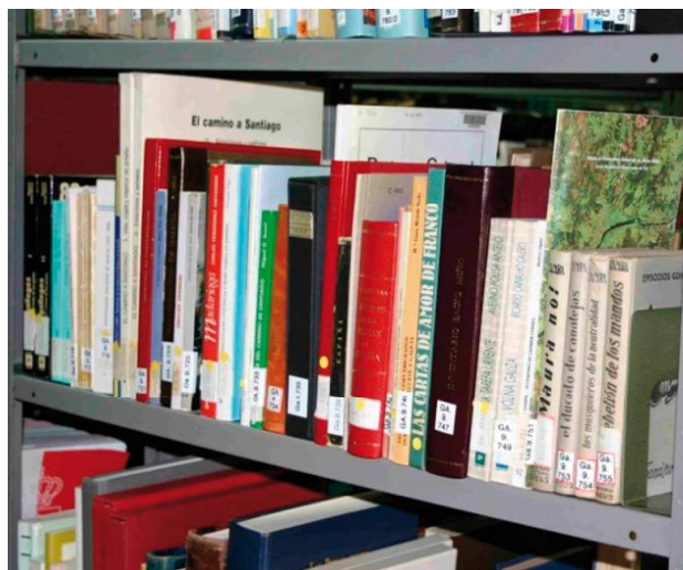
Estante da Biblioteca Universitaria de Santiago de Compostela.

Temos que destacar a inmensa riqueza desta colección, polo seu tamaño, máis de cen mil libros e tres mil cabeceiras de publicacións periódicas, e calidade, primeiras edicións, fondo patrimonial, literatura non comercial, separatas, etc., na que existen moitos exemplares únicos, que non atopamos noutra biblioteca, e da que cómpre subliñar como valor engadido o acceso aos capítulos e artigos de monografías e revistas que se ofrecen