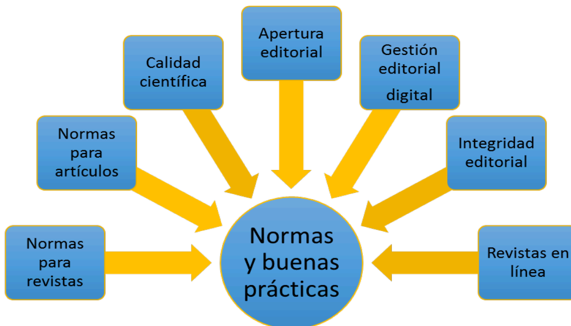
Figura 1. Aspectos que inciden en las normas y buenas prácticas de las revistas digitales

A continuación se desglosan los principales criterios para cada uno de los aspectos de la figura 1.