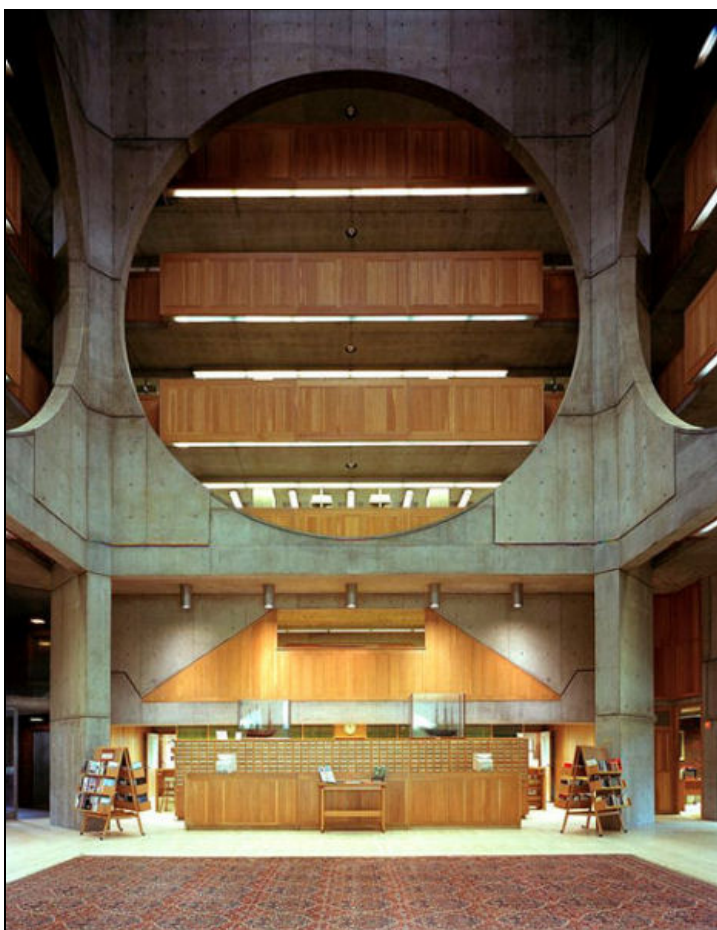
Figura 4. Zona central de la Biblioteca de l'Exeter.

La forma determina l'ús i la funció; i la funció i l'ús determinen, al seu temps, la forma que tindrà un espai concret. El material i la forma s'interrelacionen l'un amb l'altre per acabar fusionant-se de forma absoluta i total. I és que res no podria existir sense l'altre (Kohane, 1989, p. 101). En efecte, l'espai central és un petit compendi d'ordre i de lògica geomètrica; aquests aspectes per a Kahn eren molt importants, i els va agafar de l'arquitectura renaixentista, on els edificis eren una representació a petita escala de quelcom harmònic, bell, perfecte i fins i tot diví (Kohane, 1989, p. 109). El renaixementisme, transformat ara en un classicisme modern en mans de Kahn, s'aprecia clarament en les línies de la biblioteca. A més, per a Kahn les biblioteques eren una tipologia superior d'edificis: eren una porta d'accés a la cultura, a un estadi superior per a l'home, i tot mitjançant la lectura. D'aquesta manera, el contenidor de llibres (visible des de l'escala), el vestíbul d'accés i la zona interior representen simbòlicament aquesta ascensió cultural (Gil Solés, 2006).