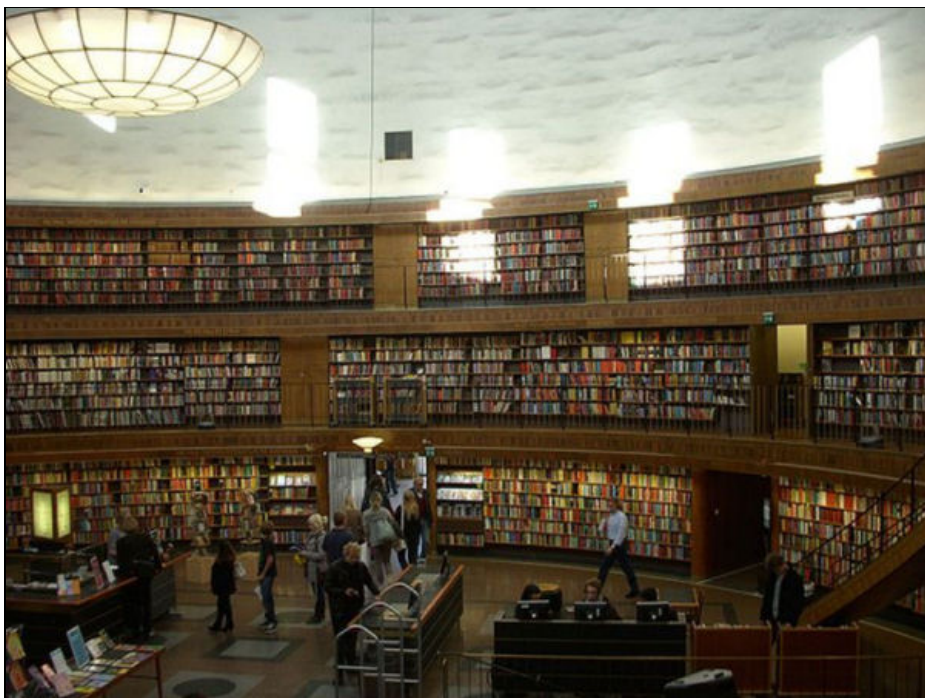
Figura 2. Interior de la rotonda de la Biblioteca Pública d'Estocolm. Autor: Holger Ellgaard. Font: Wikipedia