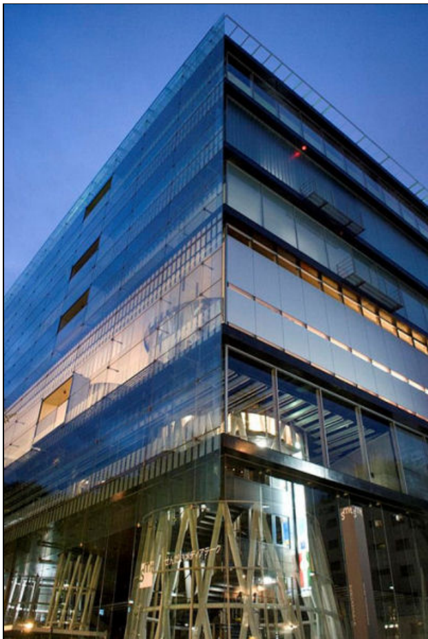
Figura 5. Mediateca de Sendai. Autor: scarletgreen. Font: Wikipedia

La tercera transformació de l'edifici de la biblioteca, aquella que posa els fonaments d'un nou model, aquella que redefeix de cap i de nou què ha de ser i com ha de ser l'edifici d'una biblioteca, aquella que escriu la introducció i els objectius d'un futur que havia de ser per força digital, neix a Sendai, amb la Mediateca de Sendai ( http://www.smt.city.sendai.jp/en/ ), obra de l'arquitecte japonès Toyo Ito. Es va inaugurar el 2001, amb el tombant de segle i de mil·lenni, i ja des del primer moment s'ha convertit en un referent ineludible en la construcció i disseny de biblioteques altament tecnificades i tecnològicament avançades (avui en dia són aspectes que ens semblen d'allò més normals i obvis). La Mediateca de Sendai ha esdevingut un paradigma, un punt d'inflexió; a partir d'ella neix el segle xxi, el segle de la digitalització massiva dels edificis de les biblioteques. I, a més, ho fa ja amb grans dosis de difuminació i d'integració invisible de la digitalització amb l'edifici, tendència que hem vist que amb els anys va ser pionera. 4