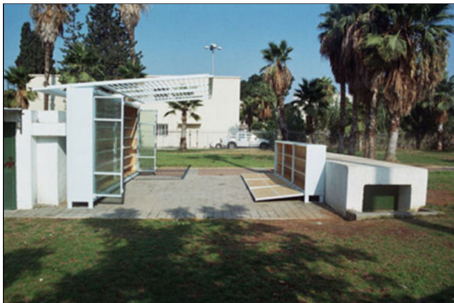
Figura 7. Levinski Garden Library. Autor: Yoav Meiri Architects. Font: Yoav Meiri Architects ( http://www.yoavmeiri.net/picBig/levinski-garden%5b1%5d.jpg )

Penso fermament que cal avançar en la desconstrucció de la biblioteca i pensar en un horitzó en què els edificis de les biblioteques també siguin mòbils, possiblement també efímers, líquids i que es dissolguin en l'entramat urbà de les nostres ciutats contemporànies i postmodernes. A les biblioteques s'hi desenvolupen activitats públiques, socials i col·lectives, però sempre amb la protecció que ens proporcionen uns límits ben clars i definits. Però el món que ens envolta no és ni clar, ni definit ni precís. Més aviat tot el contrari. La desconstrucció, la desmaterialització a què faig referència s'ha d'entendre com una descomposició líquida de l'edifici de la biblioteca. L'edifici de la biblioteca ha de deixar de ser un gran embassament ple