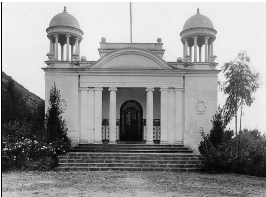
Figura 1. Façana de la Biblioteca Popular de Sallent.