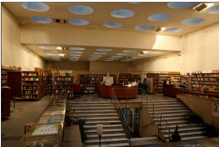
Figura 3. Interior de la Biblioteca de Viipuri. Autor: Reskelinen. Font: Wikipedia