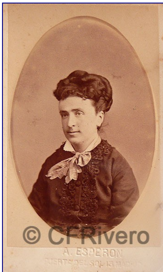
Alfredo Esperon. Retrato de señora. Madrid, ca. 1875. Carte de visite en albúmina (CFRivero)

Las noticias de su actividad se suceden como por ejemplo en 1888 sobre la disposición de Esperon a realizar gratuitamente fotografías de grupos de niños que asistieron a un festival en el hipódromo ( La Iberia 31/3/1888). Curiosa es también otra noticia en la que se ve implicado nuestro fotógrafo, nada menos que en el famosísimo crimen de la calle Fuencarral . Según relata el periódico La Iberia (29-7-1888) uno de los dos acusados, José Vázquez-Varela Borcino, apodado “El pollo Varela”, hijo de la asesinada, se hizo una fotografía con otra persona en la pradera de San Isidro el día 15 de mayo con motivo de las fiestas y esta fotografía podría convertirse en una prueba de interés para el juicio. La policía en sus indagaciones logra averiguar que el fotógrafo fue Emilio Ruiz, que había tenido un establecimiento en el solar número 6 de la Concepción Jerónima y que había estado trabajando como fotógrafo en la pradera durante las fiestas. La policía averigua también que dicho fotógrafo es, o ha sido, discípulo de Esperon por lo que se desplaza a su estudio personal del Juzgado para interrogarlo. Finalmente Esperon confirma lo aseverado por el fotógrafo en el sentido de que de esa clase de retratos no se conservan los clichés por tratarse del sistema de ferrotipia .