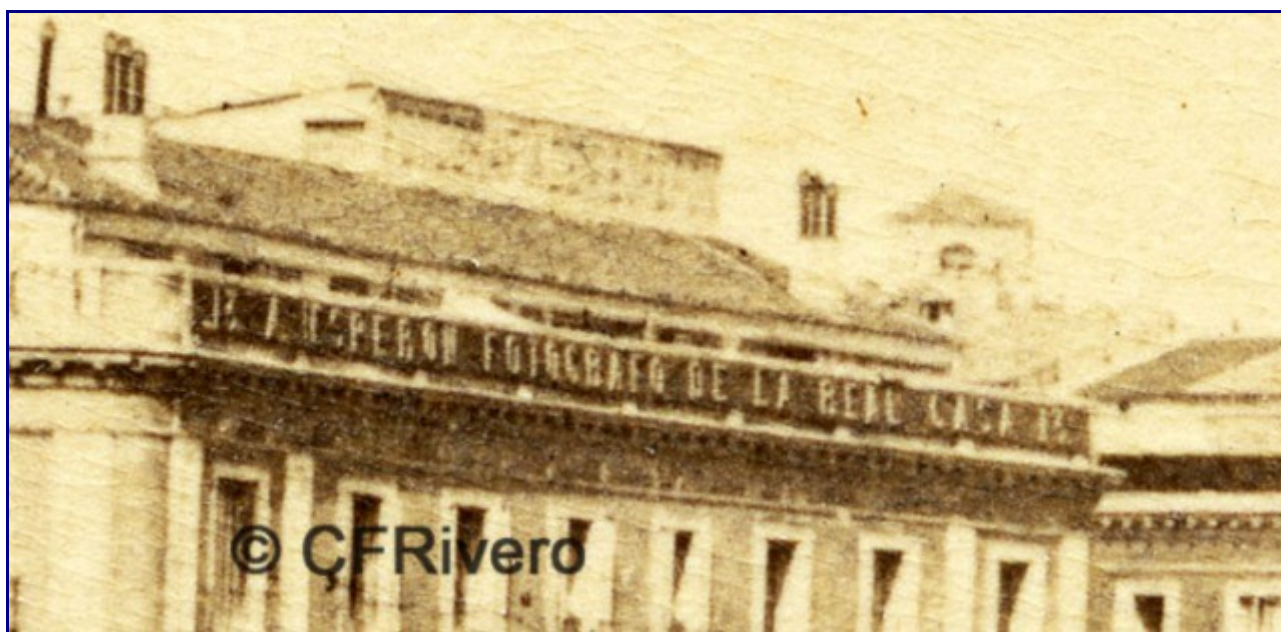
Jean Laurent. N° 41. Madrid, Puerta del Sol. Detalle. 1865-72. Albúmina