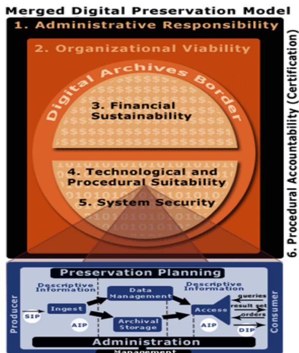
Figura 2. Diagrama da integração dos dois pilares da preservação digital baseado no modelo TDR da RLG/OCLC