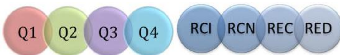
Figura 1. Escala de ocho pasos para calificar revistas mexicanas (Conacyt, 2016c).

Este cambio fue de gran relevancia para la comunicación académica en México, ya que reconfiguró los indicadores proporcionando valor a aquellas revistas que estaban incorporadas en bases de datos como Latindex, [2] Redalyc, [3] Scielo México, [4] Directory of Open Access Journals (DOAJ) y Google Académico.