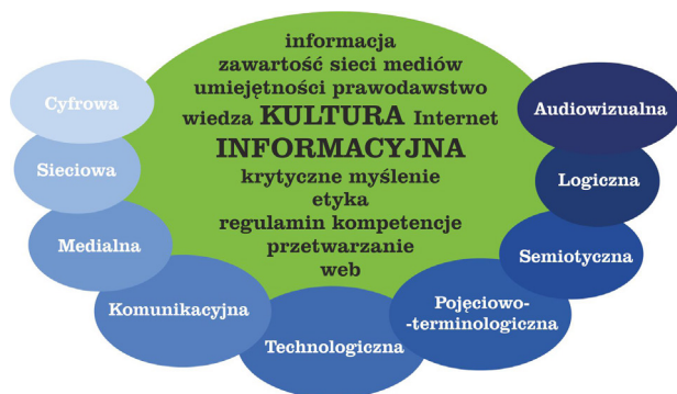
Rysunek 1. Struktura kultury informacyjnej