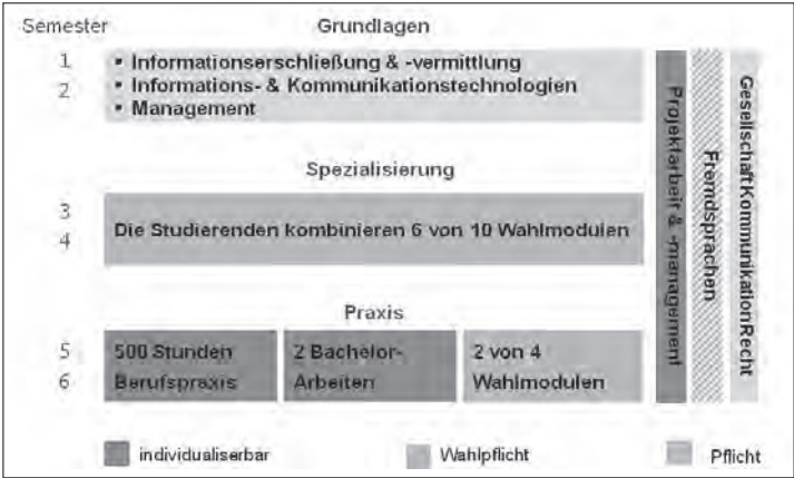
Abbildung 1: Struktur und Ablauf des Bachelorstudiengangs Informationsberufe

Die Vertiefung bestehender Englischkenntnisse sowie das Erlernen der Grundlagen einer osteuropäischen Sprache für all diejenigen, die bereits über sehr gute Englischkenntnisse verfügen. Die Studierenden haben dabei die Auswahl zwischen Kroatisch (u.a bedingt durch die kroatische Minderheit im Burgenland, siehe oben) und Russisch. Davon unabhängig vertiefen alle Studierenden über das gesamte Studium hinweg ihre Englischkenntnisse.