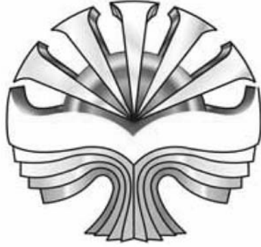
Resim 2: Endonezya Cumhuriyeti Milli Kütüphanesi Logosu

Bu görevlerin yanı sıra, Endonezya Milli Kütüphanesi, kütüphane hizmetlerinde kullanılmak üzere bilgi sistemleri geliştirme, ulusal kültürel mirası derleme ve bunları çeşitli bibliyografik kaynaklar aracılığıyla kullanıma sunma sorumluluğunu yerine getirir.