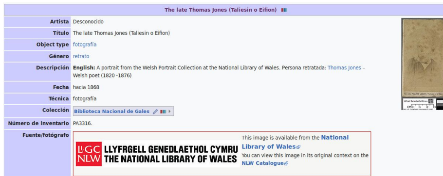
Figura 1. Ejemplo de descripción básica de fotografía antigua.

las herramientas informáticas usadas en el proceso. Incluso en ocasiones se carece por completo de estos metadatos, que no han sido considerados relevantes por la institución generadora.