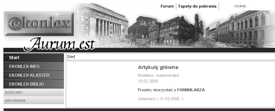
Rysunek 1. Strona platformy dziedzinowej EKONLEX

Podstawowym zamierzeniem twórców platformy EKONLEX (rysunek 1), powstałej w 2008 roku, jest skupienie informacji o najważniejszych, możliwie wszystkich, bibliotecznych zasobach prawno-ekonomicznych, zarówno w formie tradycyjnej, jak i wirtualnej poprzez e-źródła (EKONLEX Info). Drugim celem jest integracja specjalistów związanych z tymi zasobami, aby doskonalić dotychczasowe usługi i tworzyć nowe (EKONLEX Biblio). Jest też cel trzeci: propagowanie idei klastra, jako niezwykle efektywnej i nowoczesnej formy kooperacji (z ang. competition i co-operation ) (EKONLEX Klaster). Z tym ostatnim modułem platformy zintegrowana została strona domowa Wielkopolskiego Klastra Prawno-Ekonomicznego.