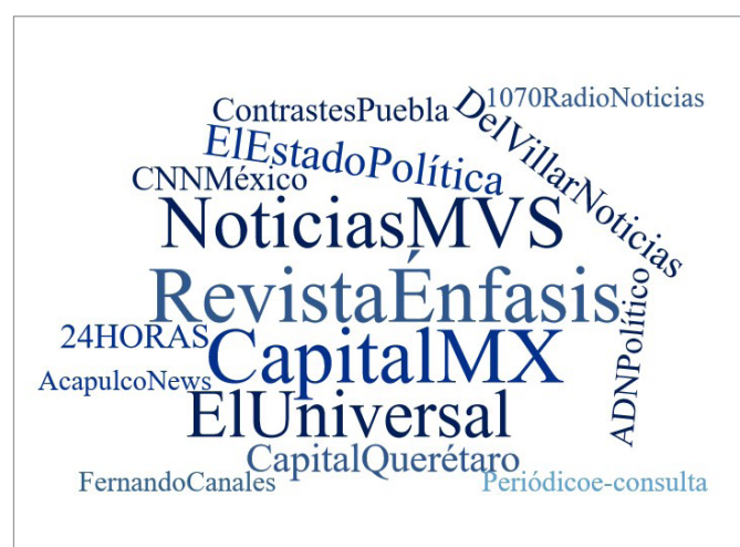
Figura 2. Representación de nube de términos de los actores mediáticos con mayor volumen de tuits, que interactuaron con la etiqueta #Elecciones 2015. Elaboración propia.

Como se observa en la Figura 1, de entre el total de perfiles mediáticos analizados, en los 5 perfiles con el mayor número