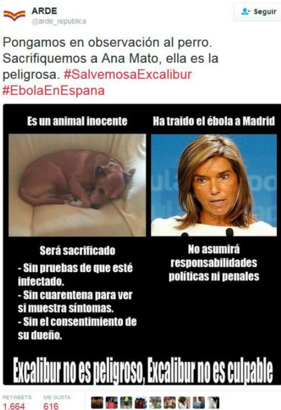
Imagen 1. Ejemplo de mensaje que se enmarca en la fase de interés.

Fase de interés: en esta emergencia abundan las bromas, los mensajes sarcásticos y las duras críticas que tienen por objetivo atraer la atención hacia el propio emisor de estas. Este tipo de mensajes son publicadas principalmente por perfiles ciudadanos tanto de tuiteros como de ciberactivistas. Algunos ejemplos: