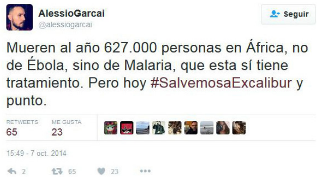
Imagen 3. Tuit crítico con el “espacio común” de la conversación.

Fase de desestructuración: aparecen escasos tuits en los que se realizan críticas a la especial atención que se puso en el caso de la mascota de la auxiliar de enfermería Teresa Romero, el perro Excalibur. Estos son algunos ejemplos: