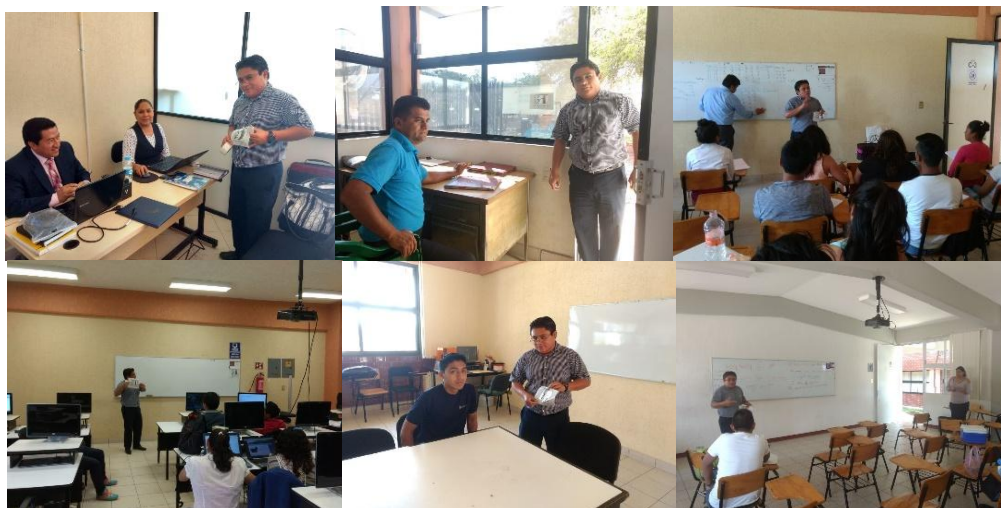
Imagen 1. Campaña de difusión.