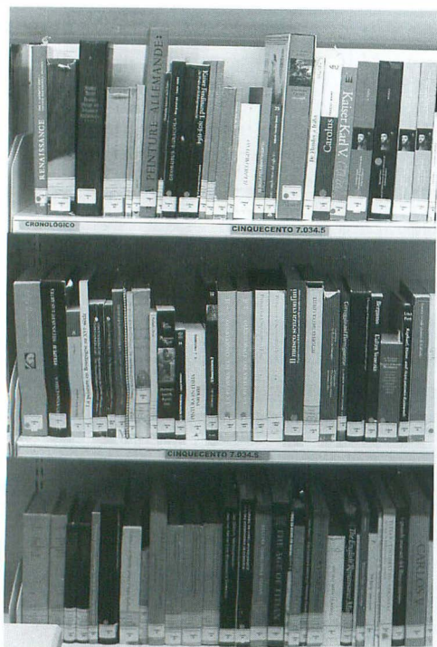
Un detalle de la colección

trata. Seis salas forman la biblioteca, distribuidas en un espacio en forma de "L", cada una identificada con un nombre propio que define el grueso de su contenido. Éste se reparte de la siguiente forma: