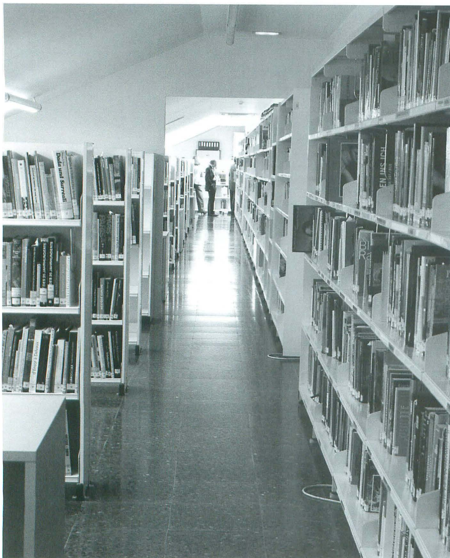
Un detalle de la biblioteca

La historia de la creación de la Biblioteca del Museo Thyssen-Bornemisza corre en paralelo con la apertura de la institución en Madrid en 1992. Desde los primeros años de su andadura se vio que era necesario formar una biblioteca que sirviera de apoyo y referencia a la colección permanente del museo y estuviera al servicio de su personal y de investigadores que realizaran estudios especialmente relacionados con los artistas representados. Se trata por tanto de un fondo muy especializado, orientado principalmente a la adquisición de publicaciones sobre artistas, épocas y estilos representados en el museo. También se ha prestado especial atención a la adquisición de catálogos de museos, colecciones públicas y privadas, obras sobre iconografía, estética y restauración.