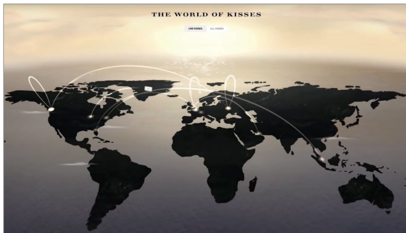
Kisses, para Burberry