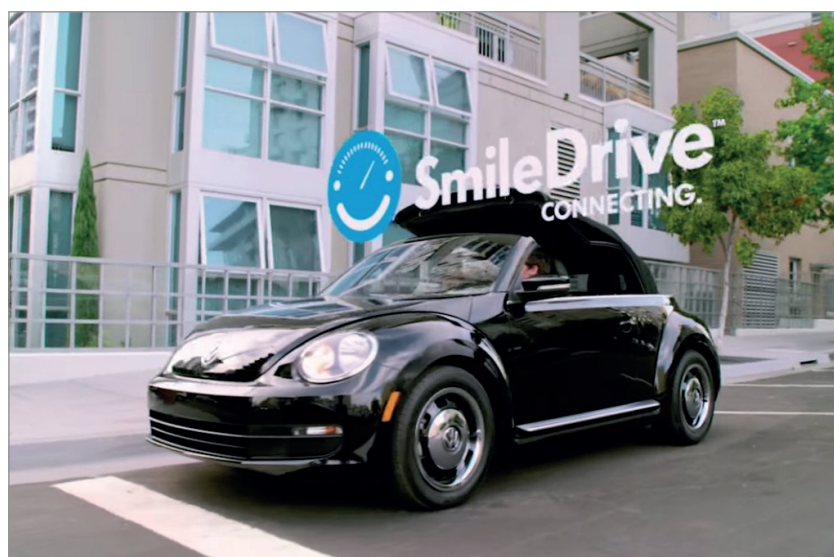
SmileDrive , para Volkswagen

“explorar nuevas formas en que la tecnología puede ayudar a construir marcas en un mundo digital. Desarrollamos campañas y experiencias que esperamos que la gente amaré, recordará y compartirá” (Google, 2016).