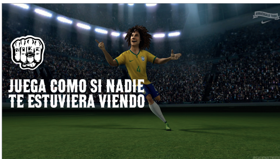
Imagen personalizada generada por Phenomenal Shot , para Nike

Una prueba de esta característica sería el hecho de que el 66% de los usuarios que descargan la aplicación de SmileDrive no son propietarios de un Volkswagen ( Google, 2016 ).