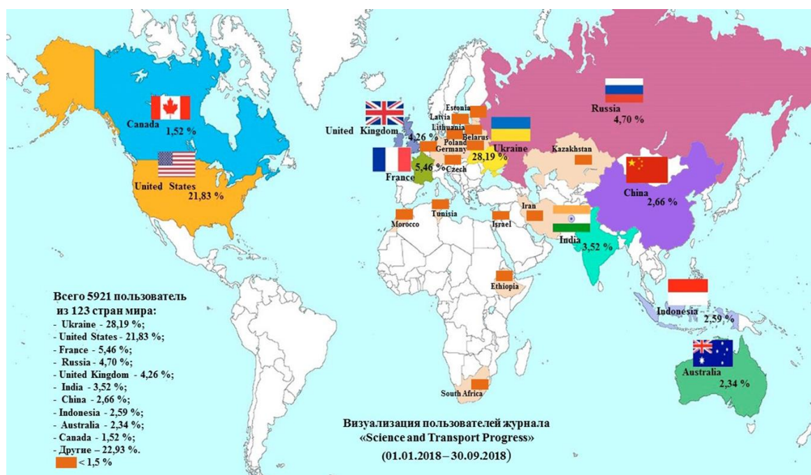
Рис. 1. Карта визуализации пользователей ж-ла “Science and Transport Progress” (01.01.2018 – 30.09.2018)

3) сопровождение сайтов научных конференций на платформе OCS – «Антропологические измерения философских исследований» и «Библиотека университета на новом этапе развития социальных коммуникаций» ( http://conflib.djit.edu.ua ), – с обеспечением публикации докладов (как в отдельных документах, так и в сборниках), их сохранения и обеспечения к ним доступа и др. Видео-отчет о конференции – https://www.youtube.com/watch?v=srko65SuCRo&list=UUsdwFCcn3mfKEffUj5Jn_3w&index=18 ).