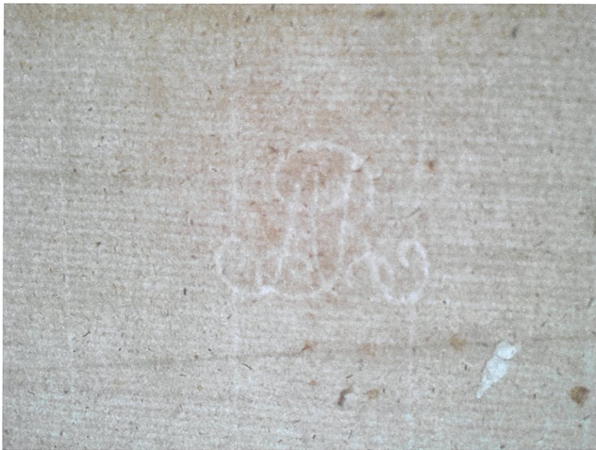
FIGURA 3. Marca d'água