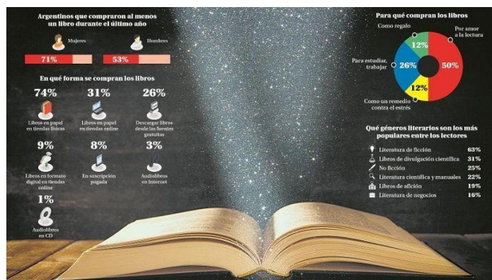
Imagen: Consumo de libros en Argentina - PICODI

realidad, podemos decir que por el momento se mantiene como la principal opción al momento de iniciar una lectura. Sin embargo, es necesario mencionar que la industria editorial se vio afectada por el incremento del costo final de la producción del libro, por lo cual, la venta disminuyó significativamente durante el año 2019.