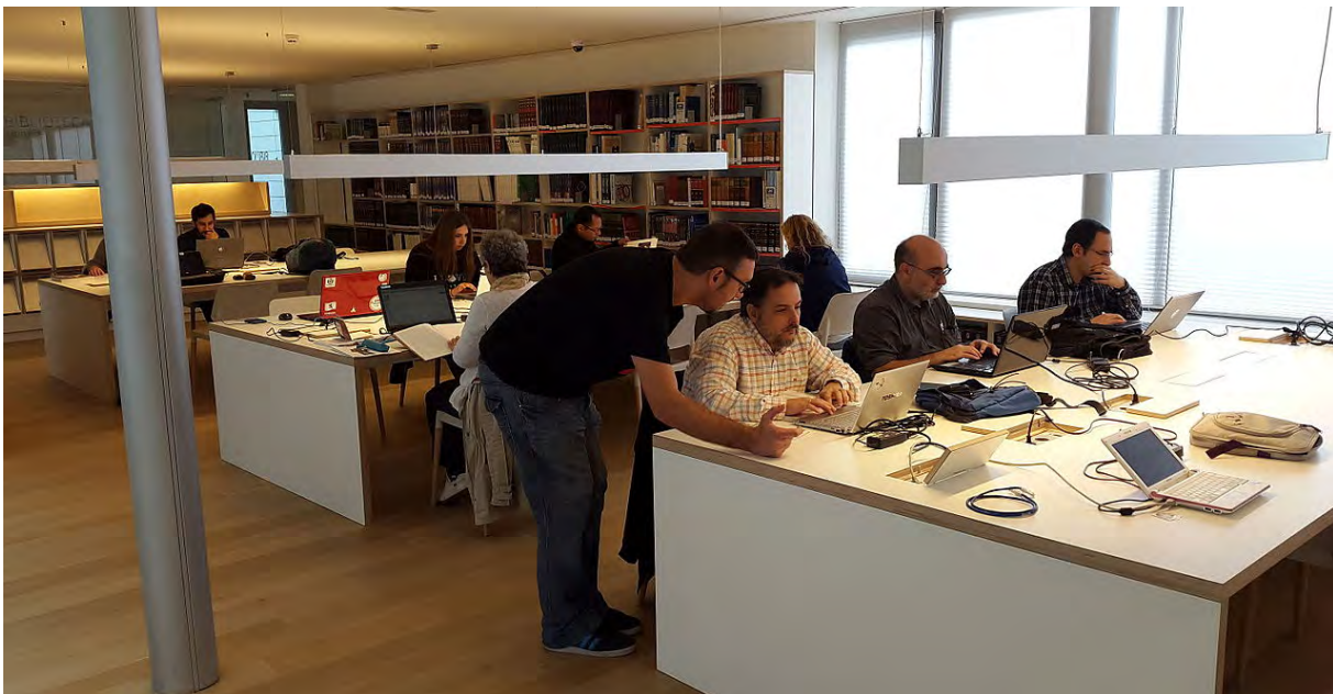
Figura 1. Trieditatón en el Museo Arqueológico Nacional.