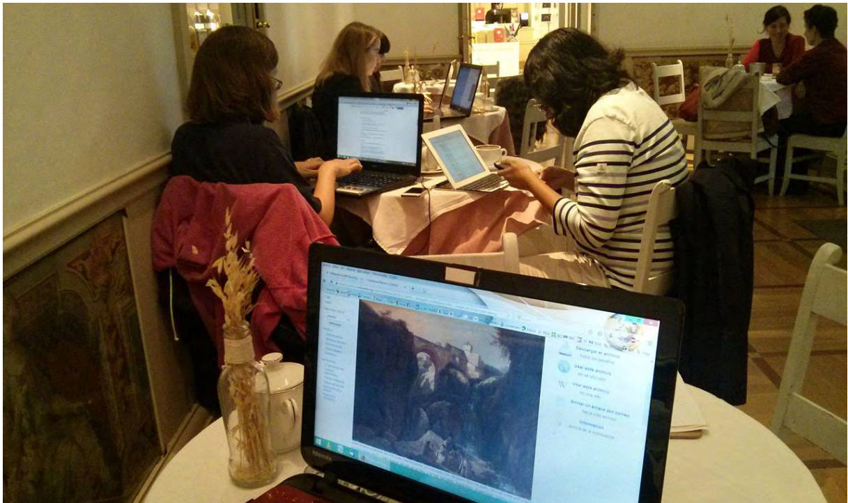
Figura 3. Taller en el Museo del Romanticismo.

Wikimedia España llevó a cabo, además, dos encuestas sobre la experiencia de los participantes en las diferentes actividades llevadas a cabo. A tal fin, se utilizó la herramienta Qualtrics, proporcionada por la Fundación Wikimedia. La primera de las encuestas fue respondida por el 68 % de los destinatarios. Entre otros datos, debe resaltarse que la mayor parte de los participantes en actividades eran mujeres, y que predominaba un nivel educativo universitario. La franja de edad más numerosa era la contemplada entre los 31-40 y 51-50 años. La frecuencia de uso predominante de Wikipedia era de varias veces a la semana, en particular un uso diario, y la actividad casi exclusiva era la búsqueda y consulta de información de referencia. Debe destacarse que casi el 70 % de los participantes indicó que confiaba «bastante» en la calidad y el contenido de Wikipedia. En lo correspondiente a la edición de contenidos, alrededor del 75 % indicaba que no había editado nunca.