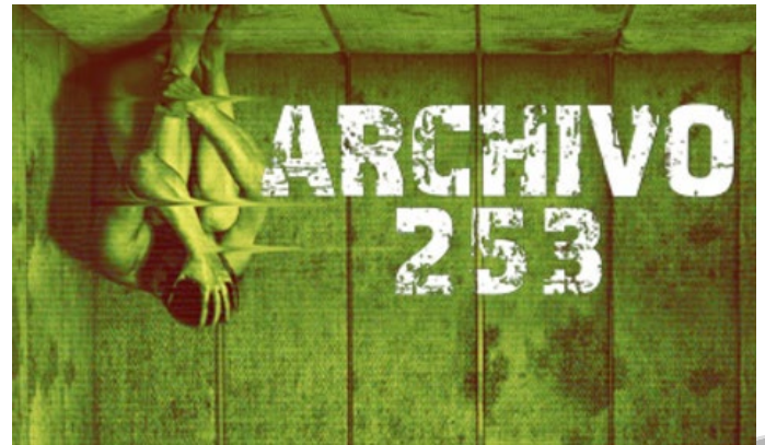
Imagen promocional de la película Archivo 253 ®, la cual retoma la idea de The Blair Witch Project ™.

manera “negativa” Archivos y/o Archivistas, no significa que siempre sea de esa manera, sin embargo, es de mencionarse que no se lograron identificar producciones mediáticas en las cuales apareciera una imagen “positiva” respecto a los mismos.