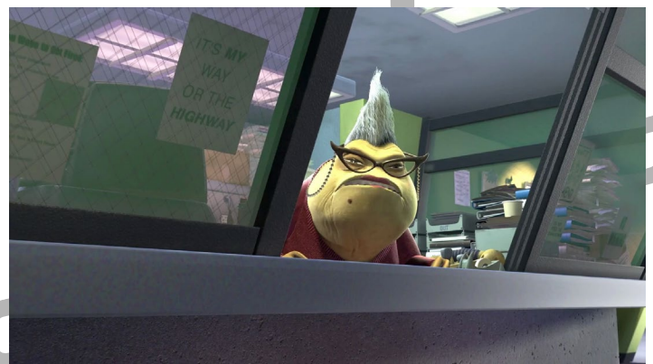
Roz™. A nivel simbólico representa el monstruo al que es necesario vencer para acceder al tesoro.

Monsters, Inc. (EU, 2001). En esta película de animación realizada por los estudios Disney y Pixar y dirigida al público infantil, se presenta la imagen de lo que se sigue considerando el típico Archivista: el viejito gruñón, enojón, solitario, cerrado y cuadrado... el personaje en cuestión es una Archivista: Roz, la cual, por cierto, trabaja para una empresa, es decir, en la iniciativa privada, lo que refuerza la imagen “genérica” del Archivista como un individuo antisocial y (leyendo entre líneas) no como un profesionista universitario, sino como un sujeto que ejerce un oficio (lo cual no tendría nada de malo si no fuera por la actitud del personaje en cuestión); por tanto, se generaliza la imagen del profesional Archivista de forma negativa y no únicamente la del Archivista que trabaja en el sector público como un insufrible burócrata.