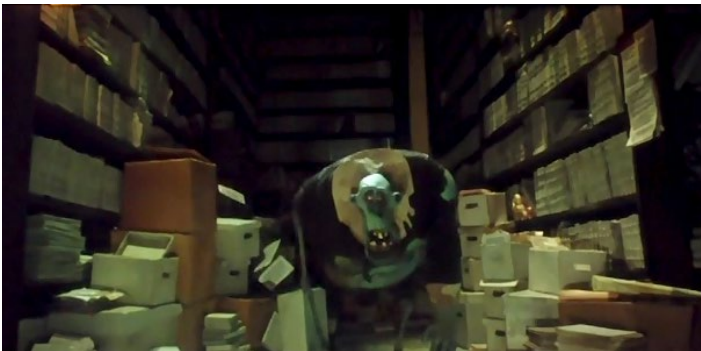
Fotograma de ParaNorman™ que conjuga varios elementos simbólicos importantes desde el punto de vista archivístico: 1) repositorio de almacenamiento; 2) Zombis y 3) la revelación del hecho o suceso.

Para encontrar el lugar en donde fue sepultada debe recurrir a los Archivos del Ayuntamiento; en la escena en cuestión, los personajes que acompañan a Norman muestran su desagrado y aburrimiento por estar encerrados en un depósito leyendo. Algo que archivísticamente es muy importante dentro de la trama, desde el punto de vista simbólico, es el hecho de que el personaje principal logra entender el contexto, alcance y significado del problema al que tiene que enfrentarse estando solo con los zombis en el repositorio de Archivo.