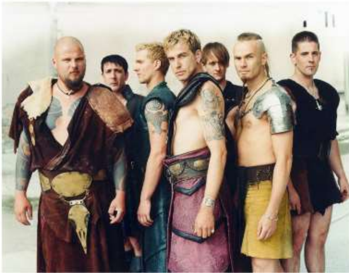
Créditos al autor 38

In-Extremo. Agrupación alemana cuyos géneros musicales son metal medieval, folk metal, folk rock y música neo-medieval. En sus canciones incluyen una gran variedad de dialectos e idiomas, muchos de ellos antiguos y medievales.