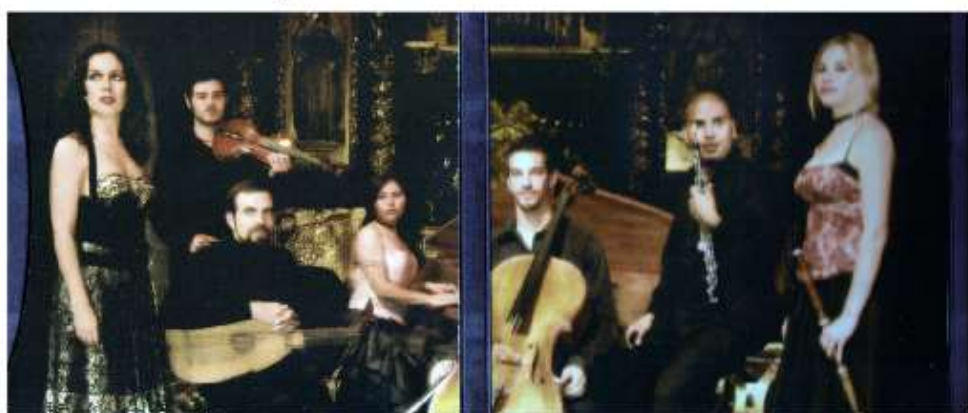
34