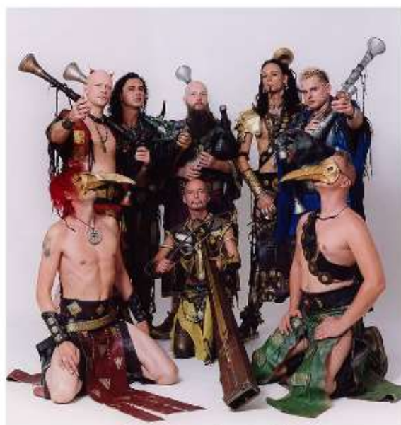
Creditos al autor 36

Corvus Corax. Grupo de origen alemán que interpreta música neo-medieval y folk metal.