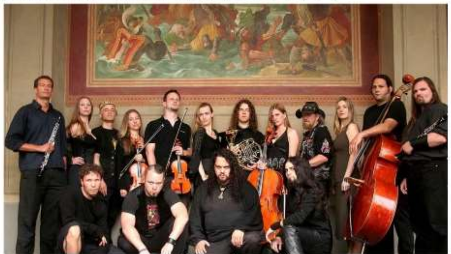
Créditos al autor 40

Varias de sus producciones discográficas se caracterizan por ser temáticas, por ejemplo, el álbum And Thou Shalt Trust... The Seer (1997), basado en la vida y obra de Michel de Nôtre-Dame, en los días de la peste negra; o el disco Eppur Si Muove (2004), inspirado en la vida de Galileo Galilei y su situación tras apoyar el modelo heliocéntrico 39 .