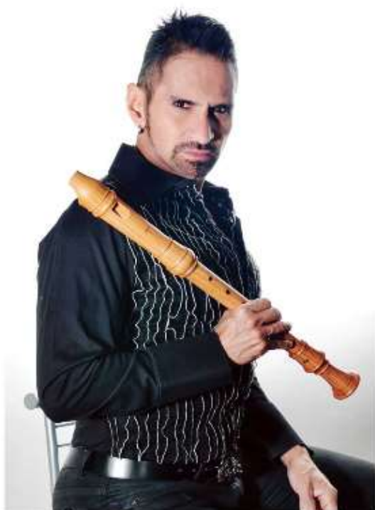
Créditos al autor 31

Algunos ejemplos de artistas que han explorado las posibilidades que ofrecen los documentos antiguos en beneficio de su proceso creativo son: