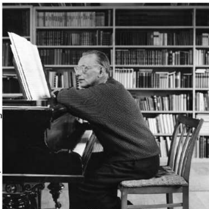
Créditos al autor 43

Con estos ejemplos, se responde afirmativamente la hipótesis de que los repositorios archivísticos sí pueden ser una fuente de inspiración y creación, y que los recursos documentales que se encuentran bajo resguardo de diversas instituciones están cumpliendo con la función que les hemos asignado en cuanto objetos de conservación: ser utilizados para generar nuevas aportaciones y perspectivas en las distintas áreas de la actividad humana; sin embargo, esto no es suficiente, hace falta un mayor acercamiento con los creadores (músicos, diseñadores, cineastas, escritores...) para poder mostrarles las posibilidades que ofrece la información resguardada por las instituciones archivísticas.