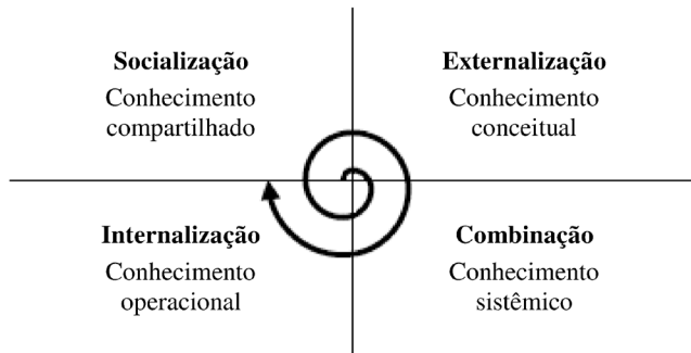
Figura 2. Espiral do conhecimento.

feita ao se estabelecer uma relação entre o conhecimento recém-criado e o conhecimento prévio da organização, cujo resultado é a geração de “conhecimento sistêmico”. Por último, o “aprender fazendo” induz a internalização, gerando “conhecimento operacional”.