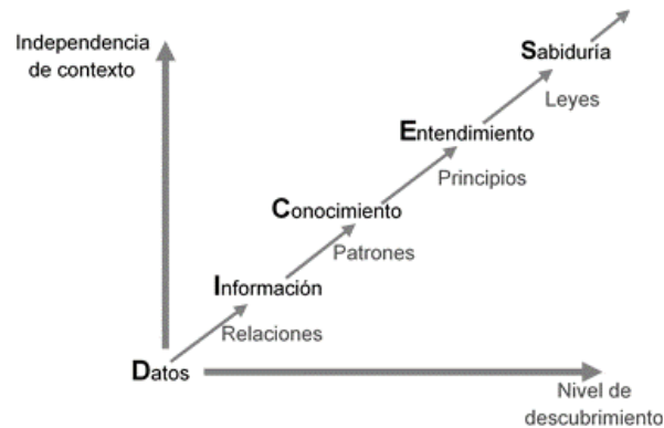
FIGURA 1. Jerarquía datos, información, conocimiento, entendimiento y sabiduría (DICES).