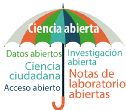
FIGURA 2. Ciencia abierta (Open Science) como concepto sombrilla. Adaptado de European Commission (European Commission. National Open Access Workshop OpenAIRE).

Las diferentes propuestas específicas para el movimiento presentan algo en común y resaltan tres elementos claves (o valores): acceso, transparencia y colaboración. 31 Las distintas definiciones apoyadas en las organizaciones de respaldo (Organización de las Naciones Unidas, ONU, Organización para la Cooperación y el Desarrollo Económico, OCDE, Unión Europea-UE, etc.) coinciden en que la ciencia abierta es un concepto integrador, esto es, un concepto sombrilla (FIGURA 2).