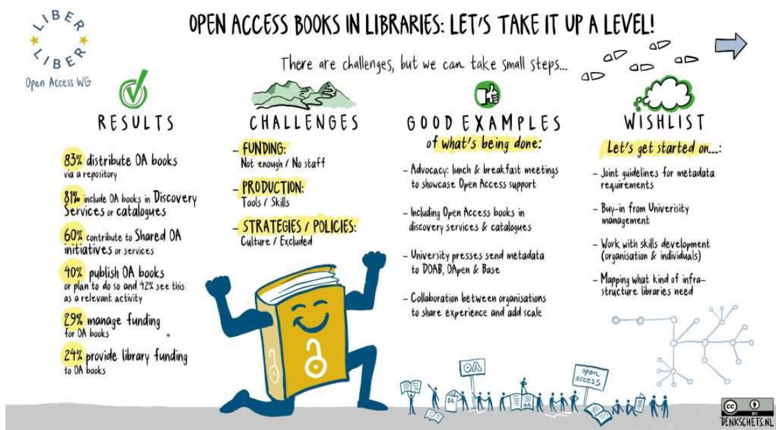
Fig. 1. LIBER Infografía sobre libros en OA

A este respecto, el Grupo de Trabajo sobre Acceso Abierto de LIBER (LIBER, 2019) formuló una serie de recomendaciones sobre el papel de las bibliotecas en la edición abierta de monografías. Según este grupo de expertos, la transición al acceso abierto de monografías acaba de comenzar, por lo que se están desarrollando nuevos modelos de negocio, y afirma que los autores parecen apoyar la idea de que todos los futuros libros académicos deberían ser de OA, aunque también afirma que ofrecer opciones en formato impreso sigue siendo importante para los lectores. En cuanto a los desafíos incluyen la infraestructura para los metadatos sobre los libros de OA, como el uso de DOI para facilitar el seguimiento y la interoperabilidad entre los sistemas, y también considera que las comunidades deben apoyar la bibliodiversidad y permitir múltiples formatos y otras innovaciones en la publicación en las que las bibliotecas tienen un papel clave en la transición hacia el libro de acceso en el contexto académico.