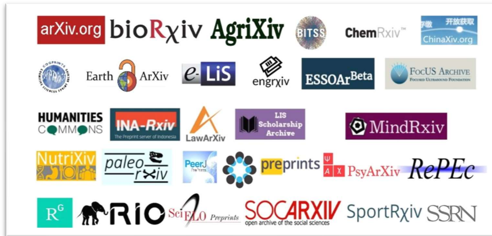
Fig. 1. Repositorios de preprints