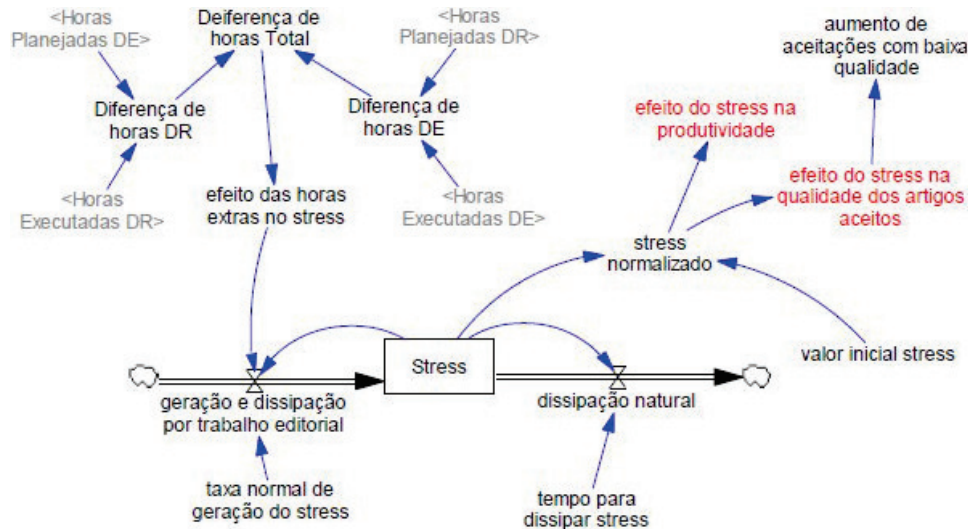
Figura 3: Modelo de geração e dissipação de estresse de editores