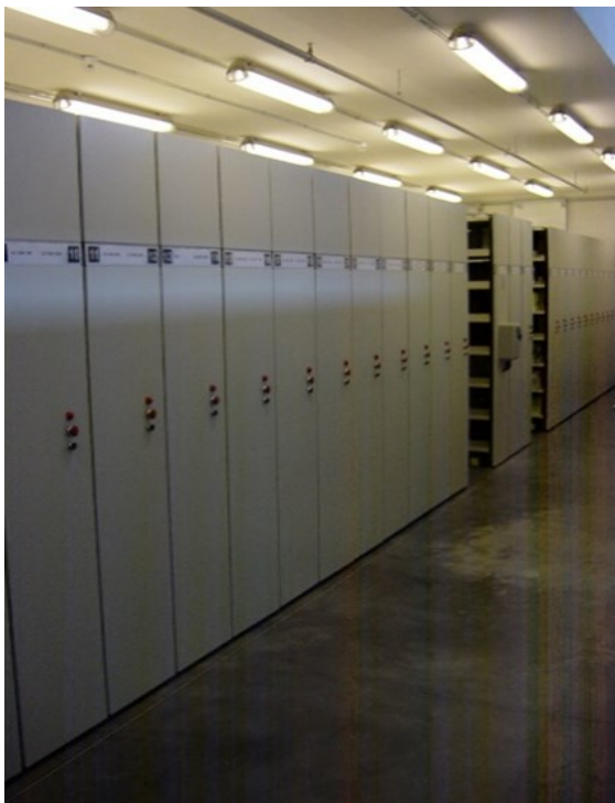
Compactus para grabaciones sonoras y audiovisuales en la Biblioteca Regional de Madrid

Al consultar la documentación musical en el catálogo de la BRM, muchas de las obras musicales que están en diferentes formatos, figuran vinculadas mediante enlaces que permiten la navegación entre ellas.