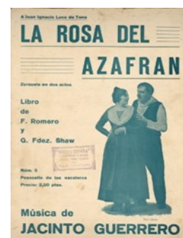
Tres ejemplos de las partituras que el usuario puede consultar en la BRM