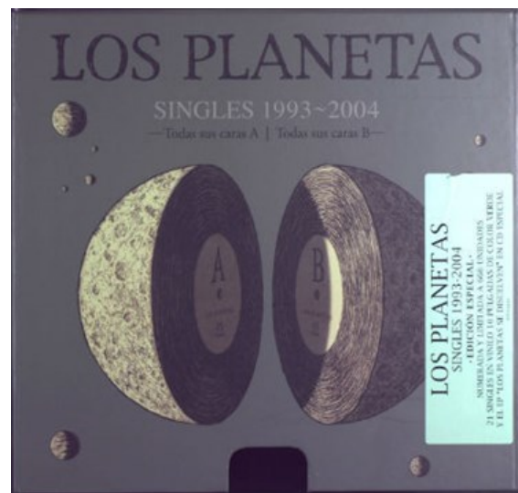
Vinilos de 45 r.p.m para la recopilación musical de Los Planetas

La Sección de Materiales Especiales cuenta con más de doscientas mil grabaciones sonoras y unas cuarenta y cinco mil partituras tanto antiguas como modernas, impresas y manuscritas. Completa su colección, una cantidad importante de monografías y obras de referencia especializadas, así como audiovisuales de naturaleza musical, carteles de temas musicales, diversas publicaciones periódicas relacionadas con la música y otros documentos. El crecimiento documental es exponencial dada la naturaleza de la biblioteca.