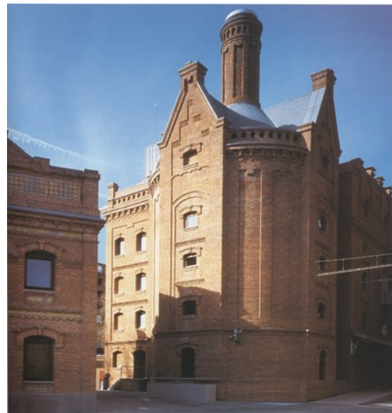
Biblioteca Regional de Madrid Joaquín Leguina

La música constituye una parte importante de los fondos de la Biblioteca Regional de Madrid (a partir de ahora BRM). De su gestión y tratamiento se ocupa la Sección de Materiales Especiales que engloba, también, audiovisuales, material gráfico (fotografía, cartelería, grabado, dibujo, ephemera), y material cartográfico. Además, uno de los objetivos principales de la BRM, es el apoyo a la difusión y la conservación del patrimonio , en este caso, el musical, en la región de Madrid, cumpliendo así una meta importante como cabecera del sistema bibliotecario madrileño.