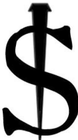
Imagen 3. Marca de esclavo.

(color de piel, lengua) que permitiesen conocer al esclavo como tal, o también como castigo destinado a esclavos rebeldes.