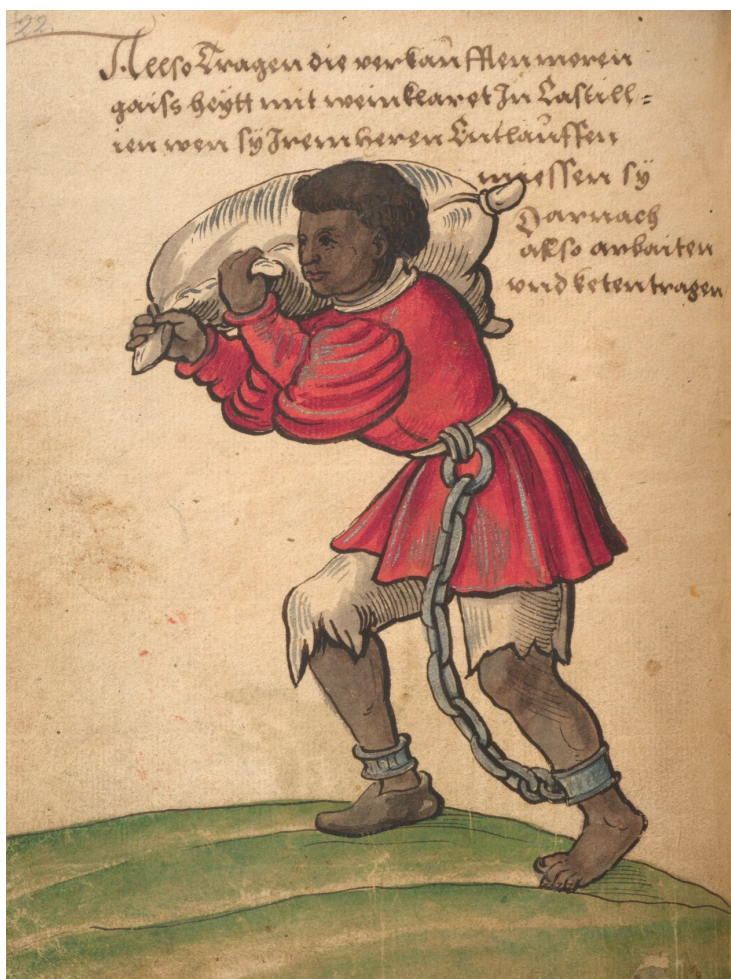
Imagen 2. Representación de un esclavo tomada de la obra de Christoph Weiditz, Trachtenbuch , fol 22-23.

venta en 1566 de una esclava negra atezada ladina de once años de edad 15 , la de un esclavo moro, color membrillo, llamado Jamete, en 1724 16 , la de un esclavo blanco