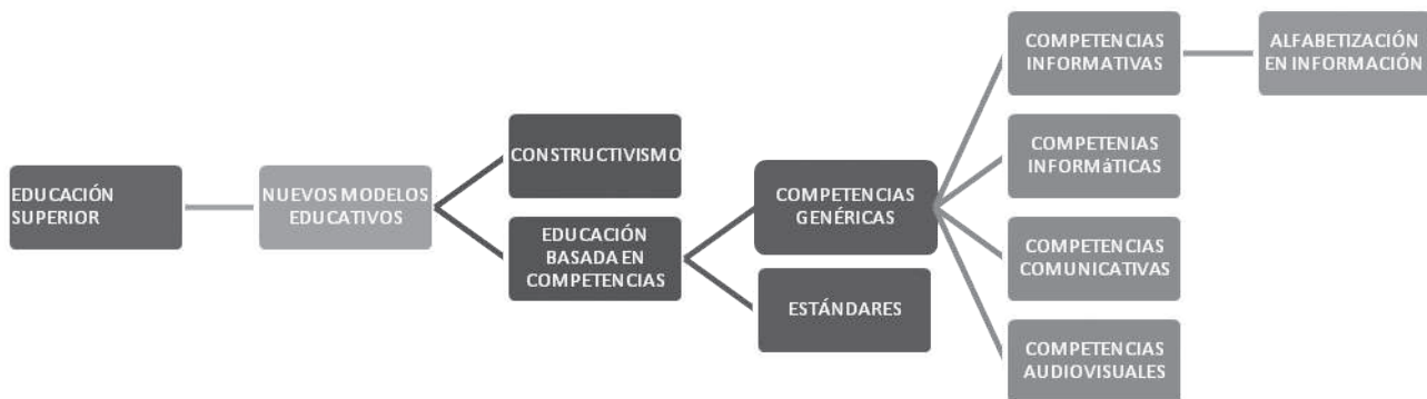
Gráfica 1. La alfabetización informacional: contexto y términos relacionados

Para la búsqueda de la información se localizaron y revisaron documentos de acuerdo a temas establecidos previamente en un guión, el cual fue elaborado a partir de un esquema de términos que inicialmente se consideraron útiles y que pueden observarse en la Gráfica 1. La revisión de la literatura se entendió como el proceso de detectar, obtener y consultar los materiales de interés para el estudio.