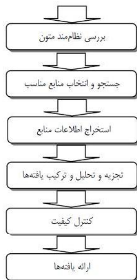
شکل ۱. مراحل هفت‌گانه فراترکیب

۴. طرح‌ریزی کردن فرایند رمزگذاری (یک برنامه کدگذاری می‌تواند از سه منبع ناشی شود: داده‌ها، مطالعات و بررسی‌های مربوطه قبلی و نظریه‌ها. طرح‌های کدگذاری می‌تواند هم به صورت قیاسی و هم استقرایی توسعه یابند. در بررسی‌هایی که هیچ نظریه و یافته قبلی وجود ندارد، پژوهشگر باید طبقه‌بندی‌ها را به صورت استقرایی از داده‌ها جمع‌آوری کند