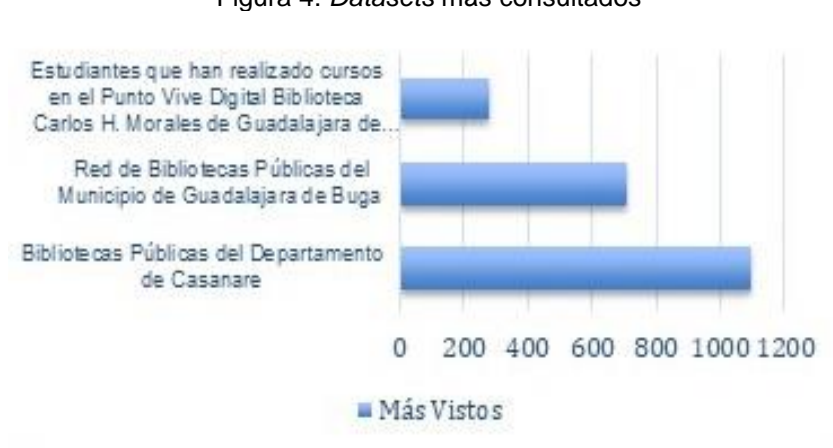
Figura 4: Datasets más consultados