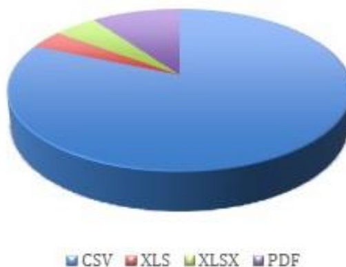
Figura 7: Recursos según formatos