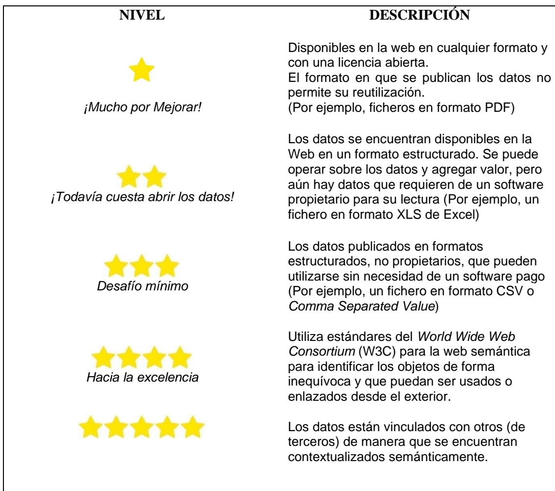
Tabla 2: Sistema propuesto por Tim Beners-Lee

Fuente: Elaborado en base a los trabajos del Ministerio de Modernización (2016), de Abella, et al. (2018); Marshall (2018); Arquero Avilés y Cuenca (2014).