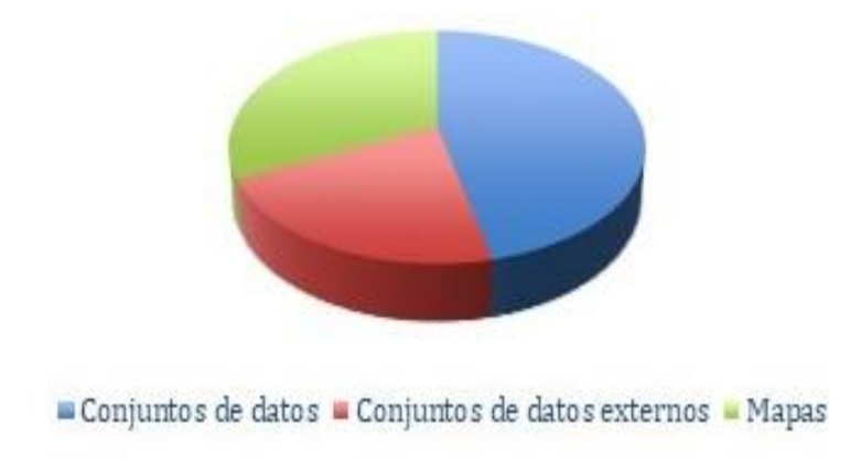
Figura 2: Activos por tipo de vistas

Fuente: Elaboración propia en base al Catálogo de datos de Colombia