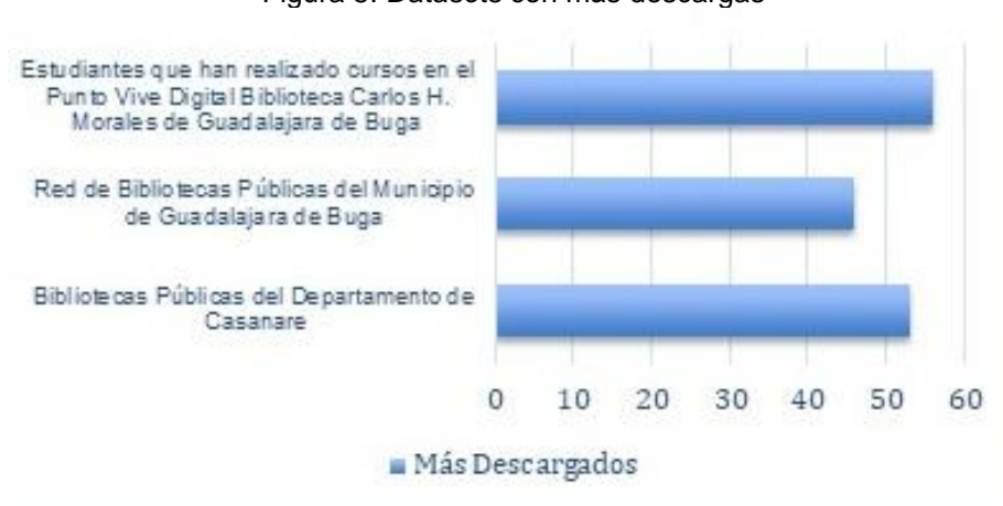
Figura 5: Datasets con más descargas