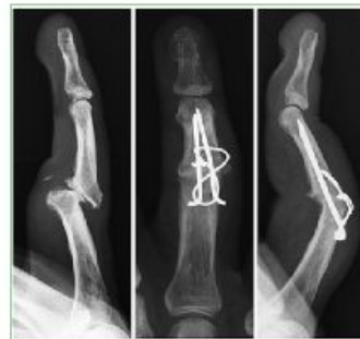
Figura 1. Artrosis interfalángica proximal de mano, postoperatorio en un paciente de 63 años. Artrodesis con banda de tensión, control a los 6 meses de la cirugía.