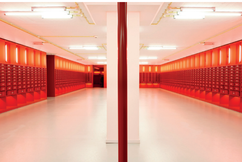
Figura 6. Habitació vermella de la Biblioteca de la Universitat d'Amsterdam. Autor: Diane. Font: Dianewantstowrite.com