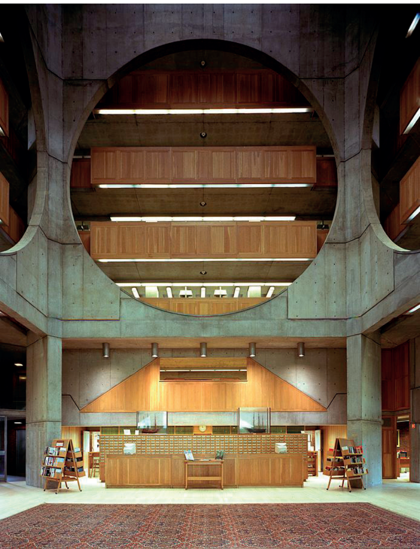
Figura 4. Zona central de la Biblioteca Exeter.