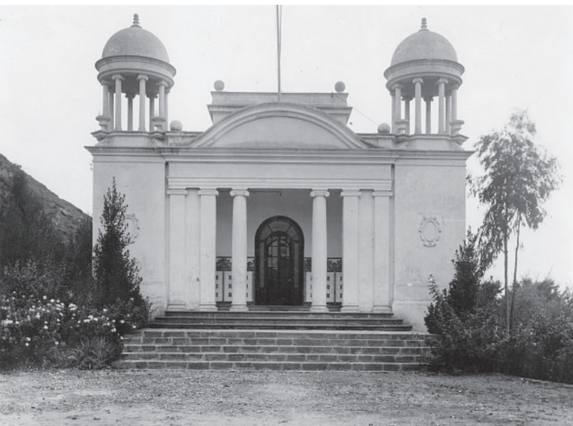
Figura 1. Façana de la Biblioteca Popular de Sallent.