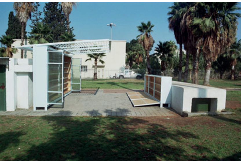
Figura 7. Levinski Garden Library. Autor: Yoav Meiri Architects. Font: Yoav Meiri Architects