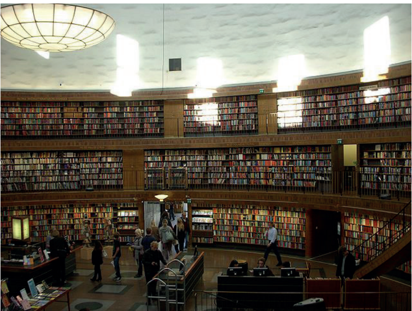
Figura 2. Interior de la rotonda de la Biblioteca Pública d'Estocolm. Autor: Holger Ellgaard. Font: Viquipèdia