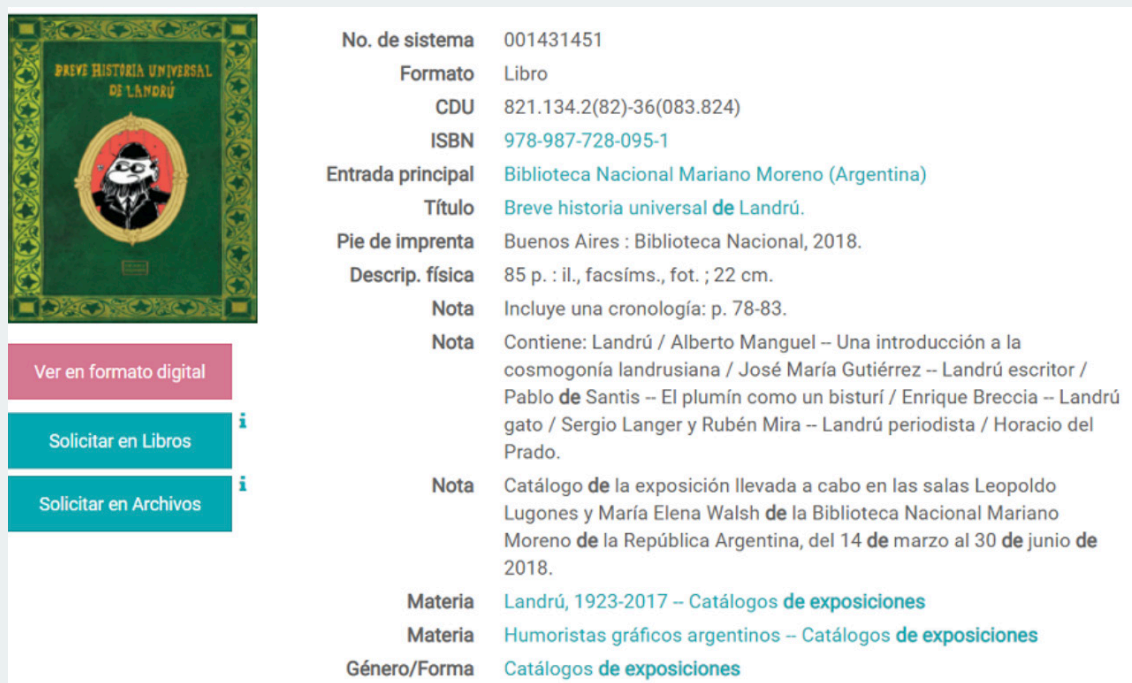
Figura 2. Vista parcial de un registro de la Biblioteca Nacional Mariano Moreno (Argentina) correspondiente a un recurso impreso. Desde este único registro se proporciona acceso a la versión en formato digital, (editada a partir del mismo original de impresión), dispuesto debajo de la imagen de la cubierta con la leyenda “Ver en