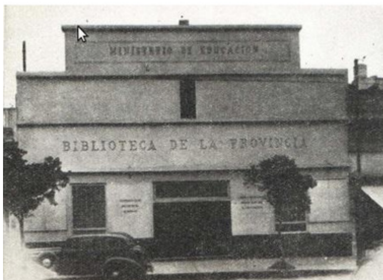
Figura 2. Frente del edificio de la Biblioteca Pública Central "General José de San Martín". Fuente: Biblioteca , 1951, 2, 3: 81.

Después de la ardua tarea de reunión y sistematización de fondos bibliográficos, la Biblioteca Provincial quedó oficialmente inaugurada el 12 de septiembre de 1951. En la celebración de apertura estuvieron presentes numerosos altos funcionarios de gobierno, autoridades de la administración pública, referentes de la bibliotecología de nuestro país y considerable concurrencia. El ministro de Educación, Dr. Julio César Avanza, cerró el acto y pronunció el discurso de inauguración de la Biblioteca de la Provincia, donde se puso de manifiesto la importancia del libro como instrumento de cultura, celebró la tarea llevada a cabo en favor de la creación de la biblioteca e invocó al pueblo en general para que contribuyera al crecimiento y el sostenimiento de la institución ( Biblioteca , 1951, 2, 4, pp. 33-38).