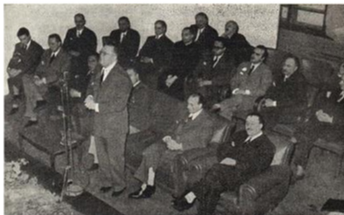
Figura 3: Inauguración Biblioteca Pública Central "General José de San Martín".

Resulta relevante mencionar que en la Biblioteca Pública Central "General José de San Martín" se realizaban al mismo tiempo otros tipos de actividades culturales. Esta institución funcionaba como sede de reuniones de la Dirección General y organizaba diversos eventos culturales, tales como series de charlas, conciertos y exposiciones. A modo de ejemplo, mencionamos un ciclo de conferencias culturales con una exposición del profesor Bruno Jacovella titulada "La Raíz Hispánica de las Tradiciones Argentinas", inaugurado el 11 de octubre de 1951 ( Biblioteca , 1951, 2, 4, p. 91).