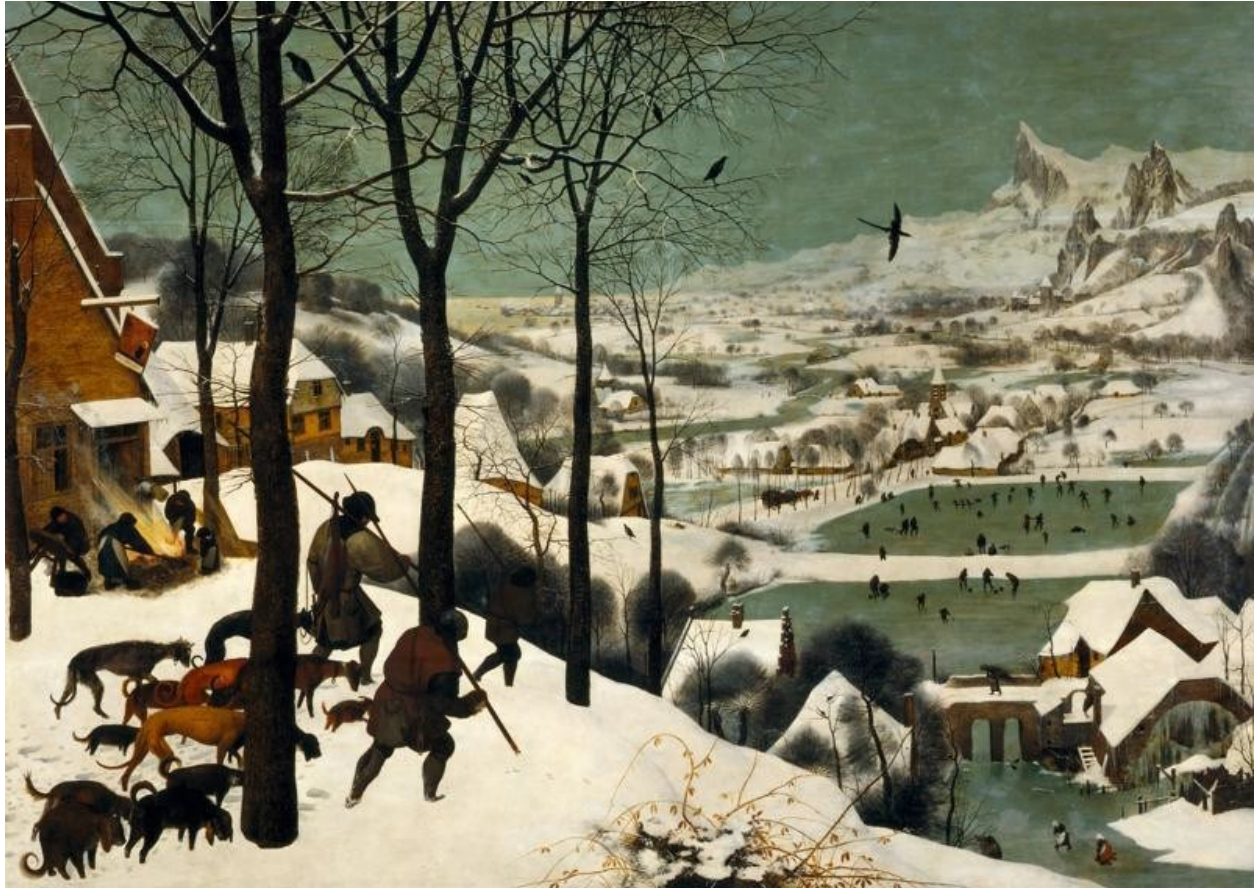
(Vânători în zăpadă (1565), de Pieter Bruegel cel Bătrân)

Nicolae Sfetcu: Filmul Solaris, regia Andrei Tarkovsky – Aspecte psihologice și filosofice momentele cele mai importante ale Solaris, în care potențialitățile și ductilitatea limbajului imaginilor ajung la vârf, este când Hari, la rândul ei, dezvoltă un proces interactiv, folosind imagini pe care le percepe vizual.