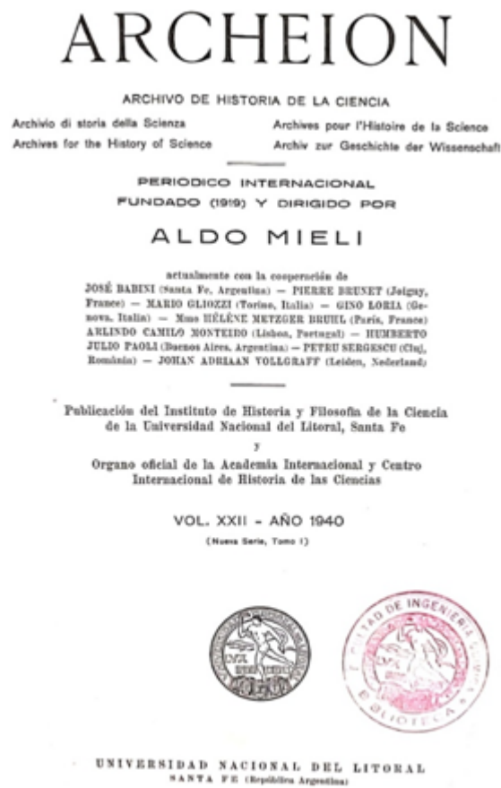
FIGURA 1 Tapa del primer número de Archeion editado en UNL (1940).