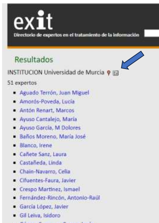
Figura 3. Lista de todos los miembros de la Universidad de Murcia inscritos en EXIT .

Ahora hacemos clic sobre el icono de tarjeta y aparece ya la orla o mosaico (figura 4).