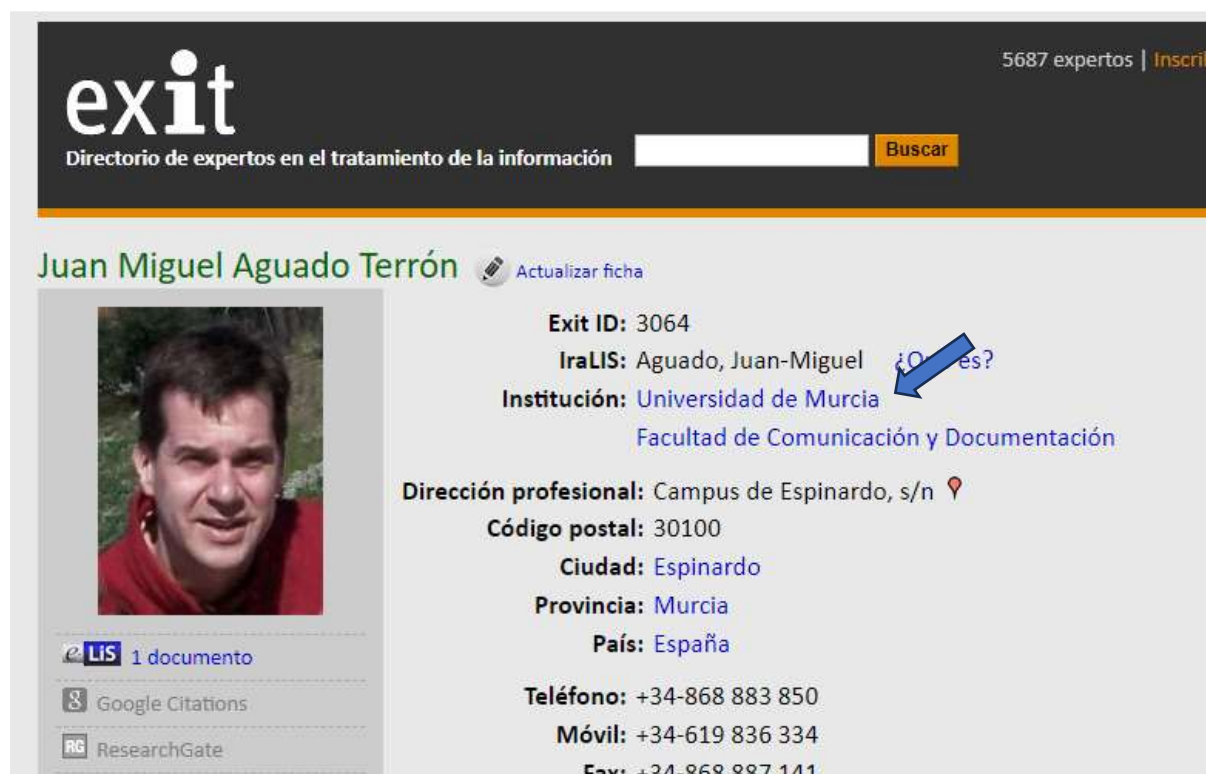
Figura 2. Ficha EXIT de un miembro de la Universidad de Murcia de la que partimos para obtener el resto de fichas.

Una vez obtenida una ficha, hacemos clic sobre Universidad de Murcia y obtenemos una lista de las personas de dicha universidad inscritas en el directorio (figura 3):