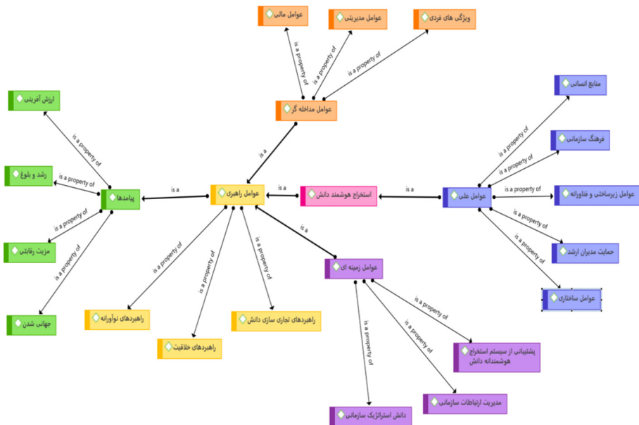
شکل ۱. مدل استخراج هوشمند دانش در نرم‌افزار «اطلس.تی.آی»

در بخش کدگذاری باز مؤلفه‌های استخراج دانش در بخش مصاحبه تفکیک شده و در ۱۸ گروه دسته‌بندی شدند. همچنین، مدل مفهومی خروجی در نرم‌افزار «اطلس.تی.آی» در شکل ۱ ملاحظه می‌شود.