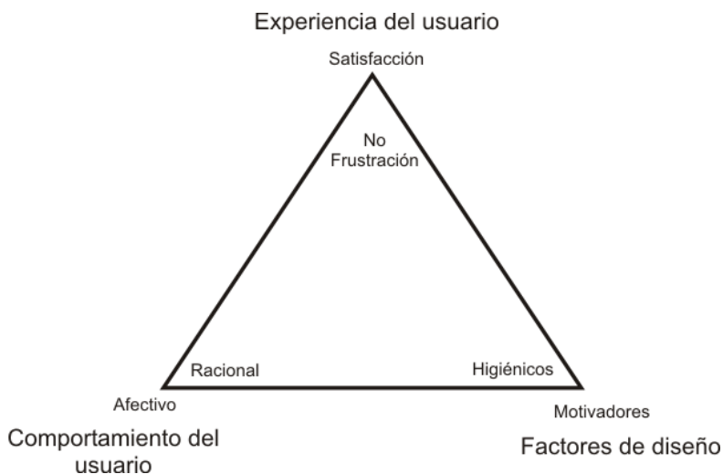
Figura 1 Resumen del marco teórico

Así pues, para los propósitos de este trabajo, podemos tomar como modelo de partida el representado en la figura 1. Se trata de un modelo multidimensional, donde cada una de las variables –experiencia del usuario, factores de diseño y comportamiento del usuario– poseen dos dimensiones interrelacionadas con las del resto de variables. Los factores higiénicos influirían en el comportamiento racional del usuario durante la interacción, condicionando ambos la no frustración de uso. Por su parte, los factores motivadores influirían en el comportamiento afectivo, condicionando ambos la satisfacción de uso.