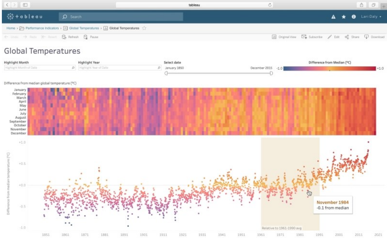
Server de temperaturi globale.