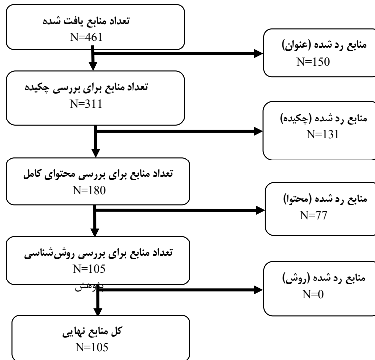
شکل ۲. نحوه بررسی، ارزیابی و انتخاب منابع نهایی پژوهش

نهایت ۱۲ منبع که کمتر از ۳۰ امتیاز را به خود اختصاص دادند، حذف شده و تعداد ۹۳ منبع وارد مرحله بعد شدند. در شکل ۲، نحوه بررسی، ارزیابی و انتخاب منابع مناسب و متناسب با اهداف پژوهش آورده شده است.