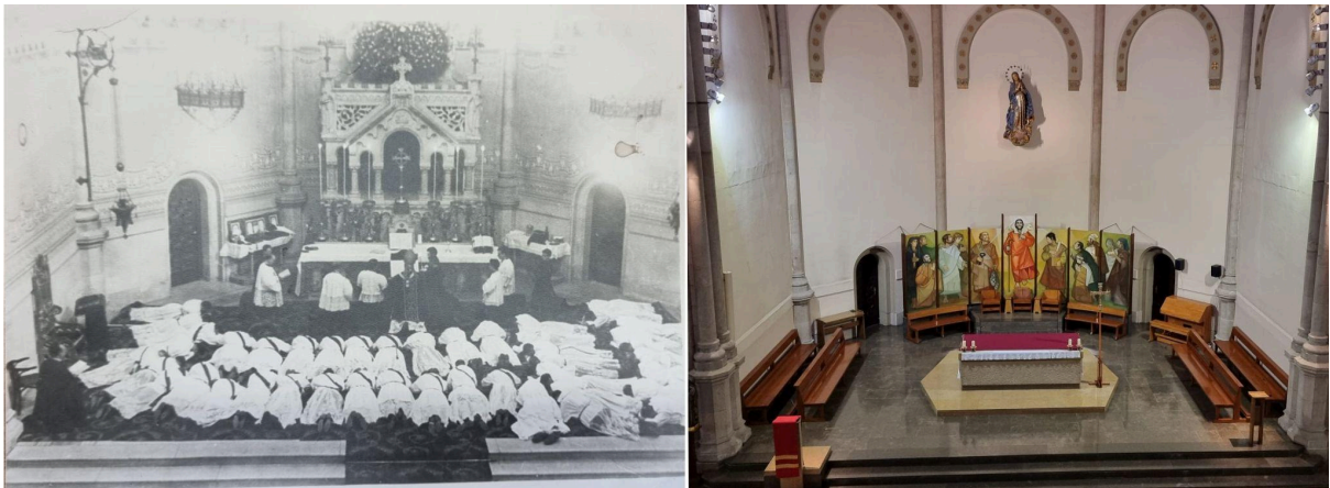
Capella del Seminari, en una ordenació del 6 de juny de 1936; i estat actual de la Capella, on es poden veure els elements destruïts i no recuperats