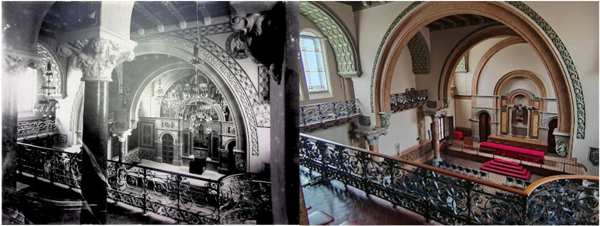
L'Aula Magna del Seminari, a l'esquerra abans de 1939, i a la dreta l'estat actual, on es poden veure el elements que es van destruir i que no s'han recuperat